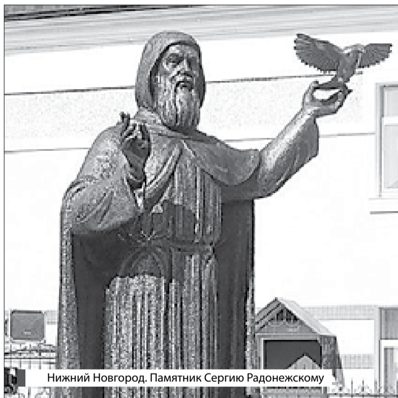
Нижний Новгород. Памятник Сергию Радонежскому

святых, вместе со своим старшим братом Стефаном Сергий уходит жить в леса, где строит небольшую церковь в честь Живоначалной Троицы (довольно редкое для того времени посвящение). Брат вскоре покидает будущего святого, не выдержав тягот отшельнической жизни, а через некоторое время его место занимают другие монахи, ищущие уединения и покровительства преподобного. Эта маленькая лесная обитель впоследствии вырастет в огромный монастырь, который сегодня знаменит не только в России, но и за рубежом. Думаю, что вы, дорогие читатели, уже поняли, что речь идет о Троице-Сергиевой лавре , где в Троицком соборе (бывшем когда-то той деревянной церковкой) сегодня и находятся мощи преподобного. До революции лавра была настоящим культурным явлением в жизни нашей страны, потому что огромное число верующих шло пешком со всех ее концов в паломничество к мощам прославленного святого или на престольные лаврские праздники. Так святой и после своей