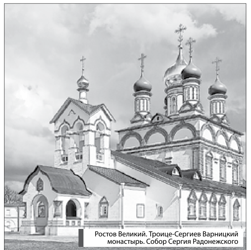
Ростов Великий. Троице-Сергиев Варницкий монастырь. Собор Сергия Радонежского

Удостоившись видения многих чудес при жизни, весть о своей кончине будущий святой тоже получил чудесным образом аж за полгода до нее. Перед самым смертным часом он причастился Святых Христовых Таин , как подобает истинному христианину, и так напутствовал брата монастыря: «Нужно вам единомыслие друг с другом хранить, иметь чистоту душевную и телесную и любовь нелицемерную, а особенно смирением украшать себя, страннолюбия не забывать, от противоречия уклоняться, и ни во что ставить честь и славу жизни этой, но вместо этого от Бога воздаяния ожидать». Затем святой спокойно отошел ко Господу 8 октября (25 сентября по старому стилю) 1392 года. Это событие мы и будем отмечать в предстоящую субботу. После смерти монахи не захоронили тело святого, а положили в специально устроенной раке (место для мощей) в церкви. Это событие и чудеса от мощей и послужили быстрому прославлению святого по всей Русской земле, не зря же он и был назван ее игуменом.