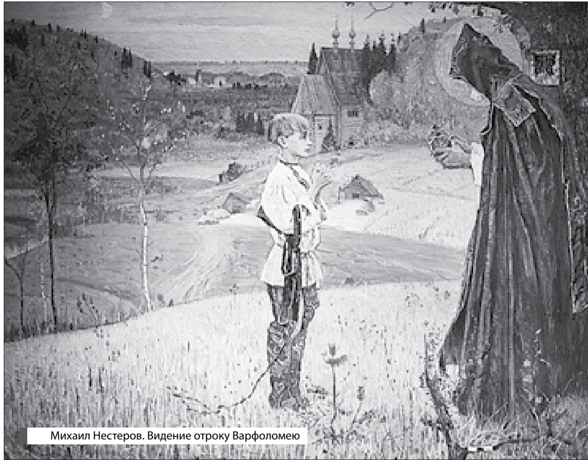
Михаил Нестеров. Видение отроку Варфоломею

После кончины своих благочестивых родителей, которые перед смертью приняли постриг, а потом тоже были причислены к лику