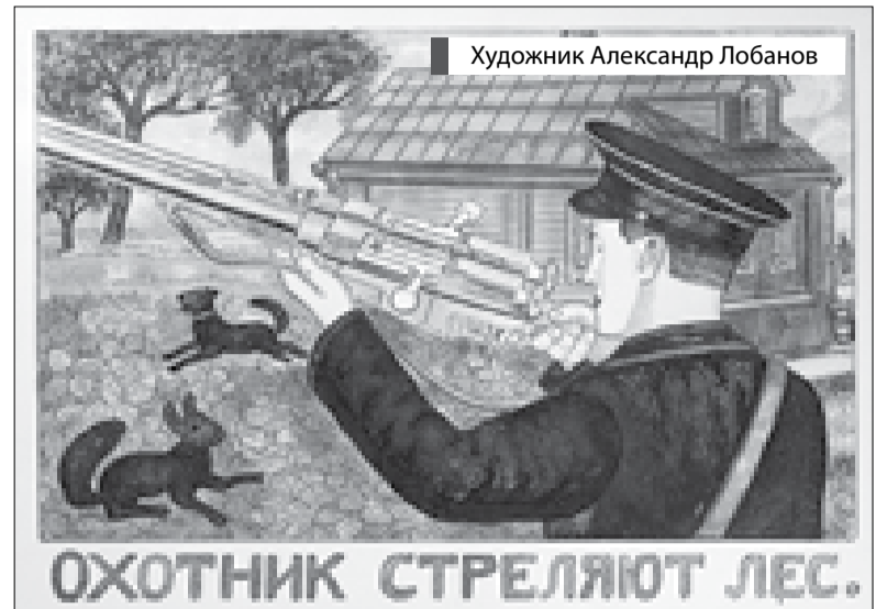
Художник Александр Лобанов