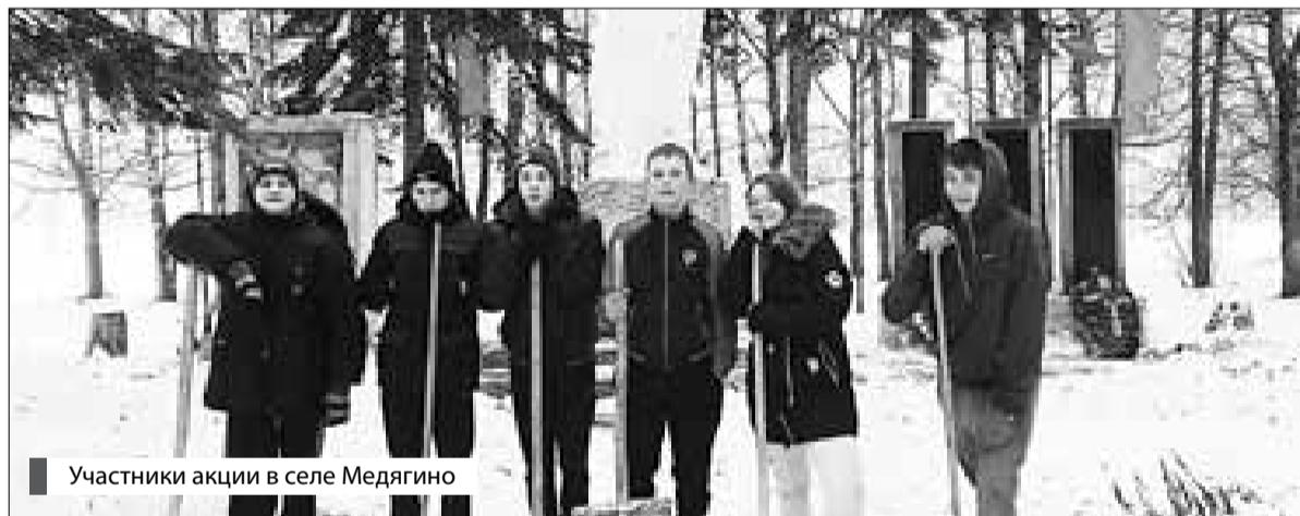
Участники акции в селе Медягино