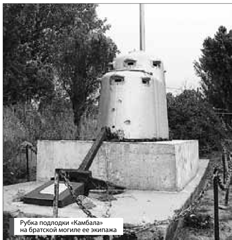
Рубка подлодки «Камбала» на братской могиле ее экипажа