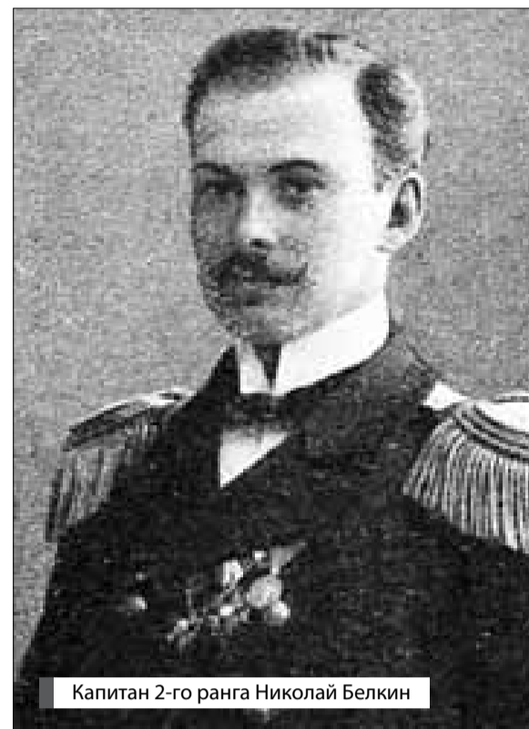
Капитан 2-го ранга Николай Белкин