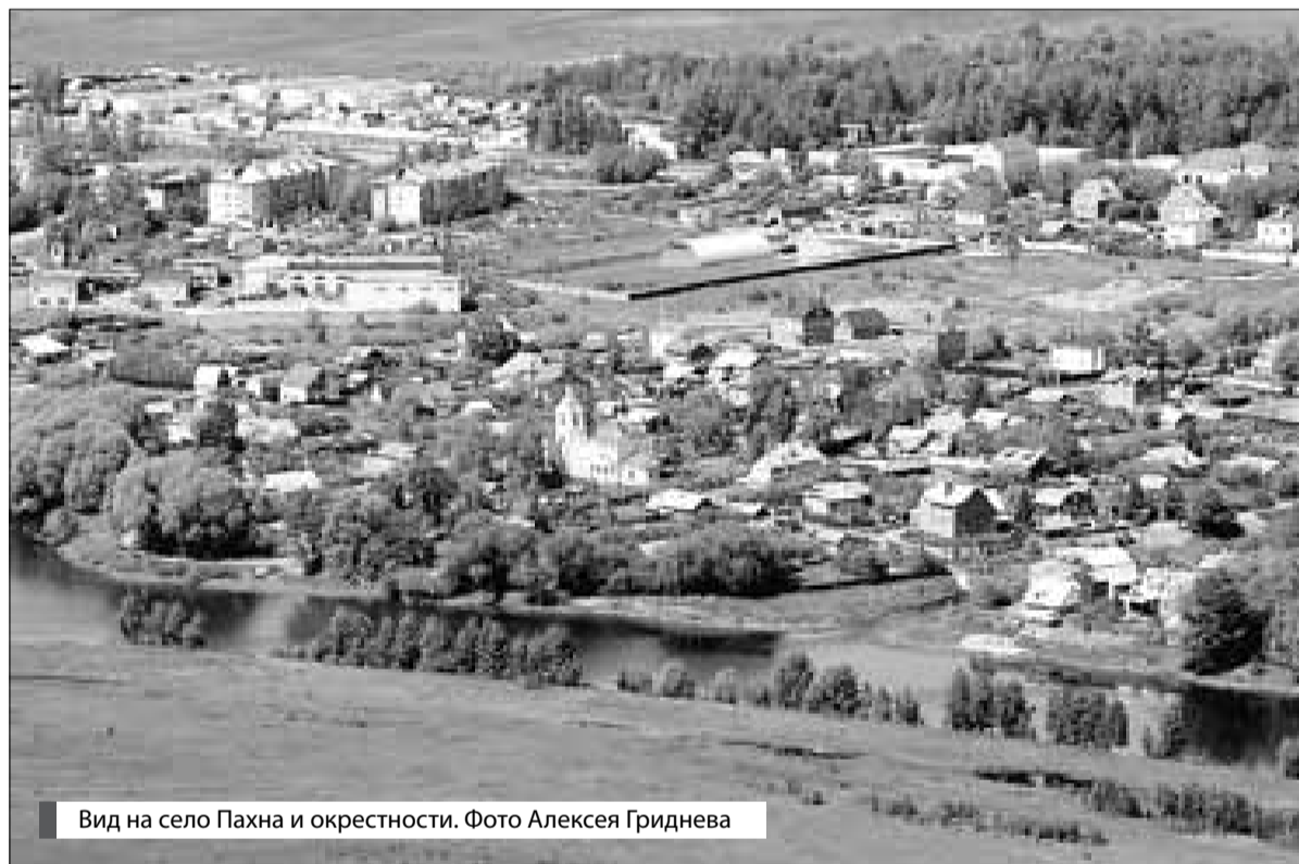
Вид на село Пахма и окрестности.

ца-Пахма) и представляет собой четверик с боковыми портиками и мелким декоративным пятиглавием, с трапезной и ярусной колокольней. Престолов два: Святой Живоначальной Троицы – в летнем храме; благоверного князя Федора Смоленского и чад его Давида и Константина, Ярославских Чудотворцев – в зимней трапезной. Особо почиталась икона Николая Чудотворца. Посвящение теплого престола в честь Ярославских Чудотворцев не случайно: по преданию, на этом месте в XIV веке находилась их загородная резиденция.