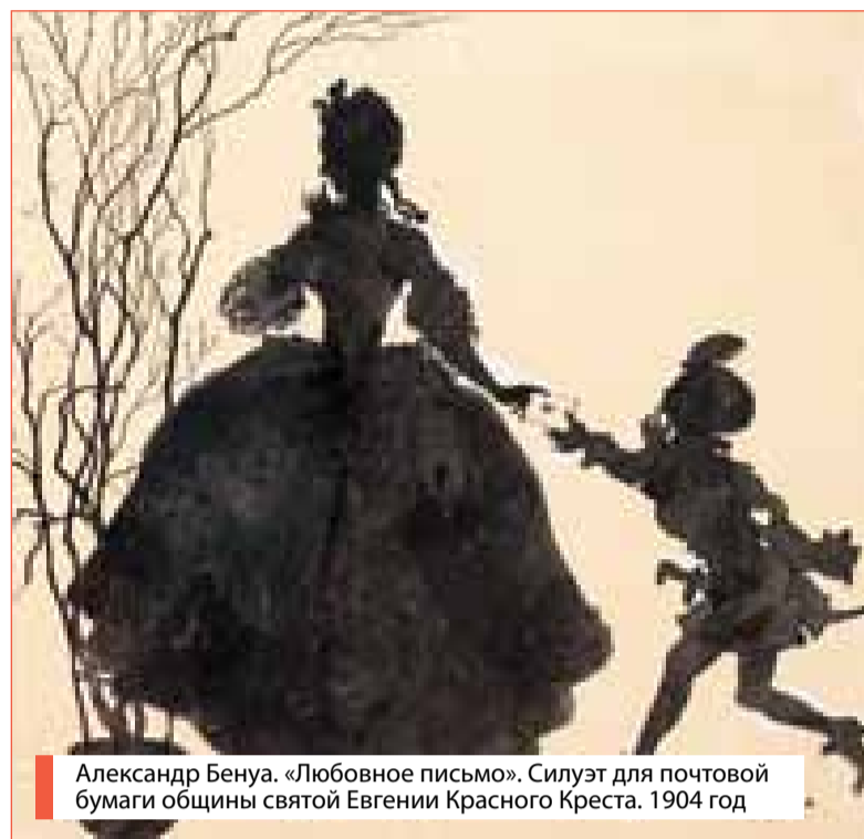
Александр Бенуа. «Любовное письмо». Силуэт для почтовой бумаги общины святой Евгении Красного Креста. 1904 год