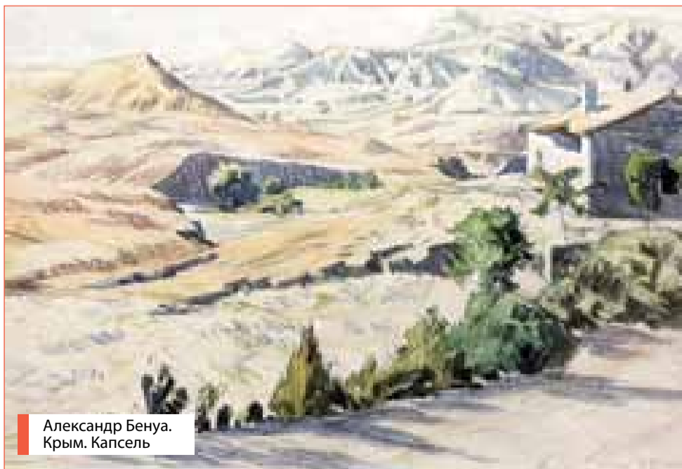
Александр Бенуа. Крым. Капсель