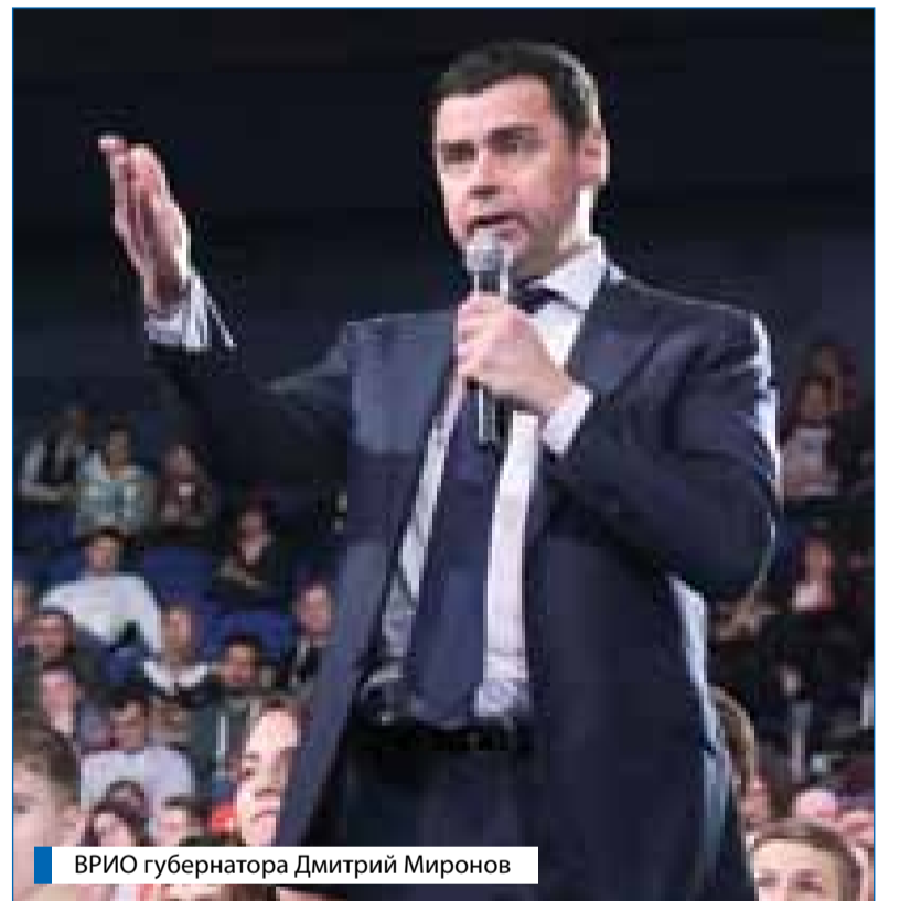
ВРИО губернатора Дмитрий Миронов