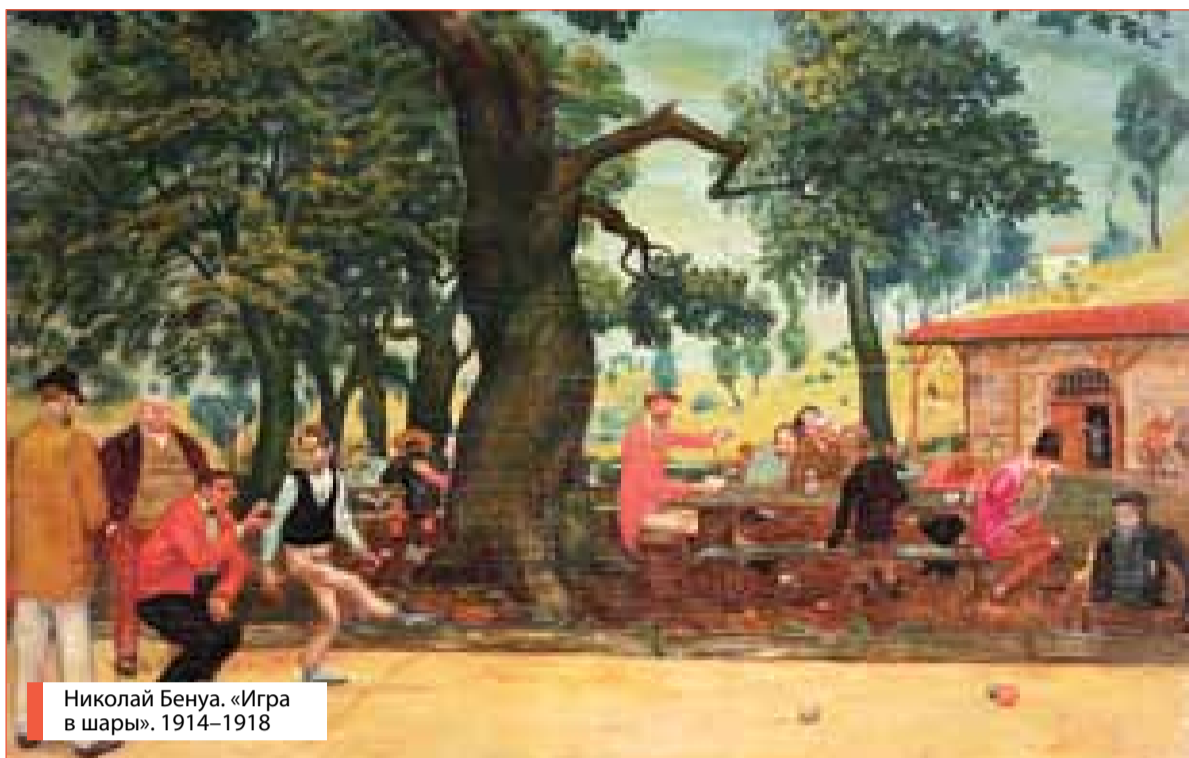
Николай Бенуа. «Игра в шары». 1914–1918