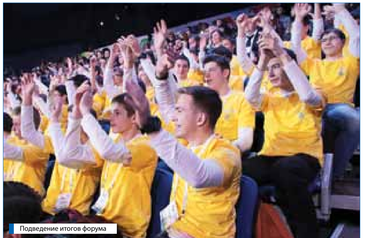
Подведение итогов форума