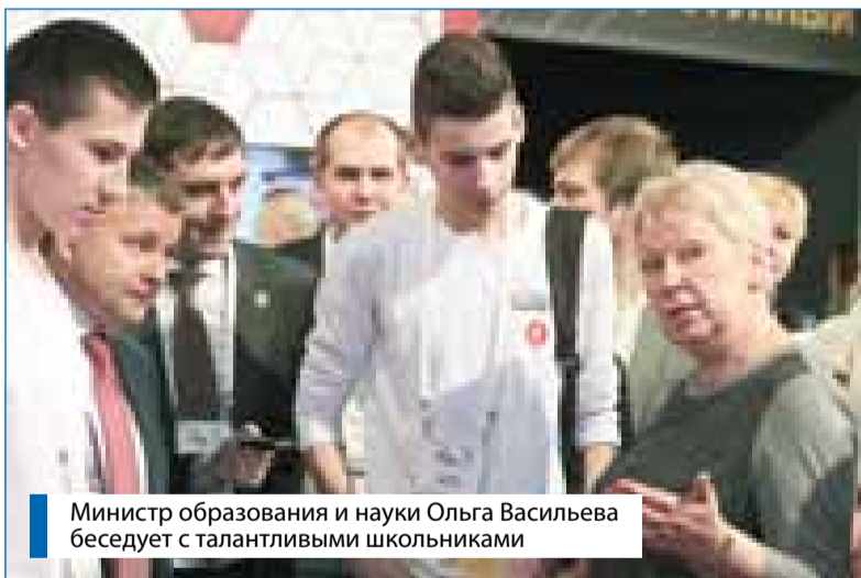
Министр образования и науки Ольга Васильева беседует с талантливыми школьниками