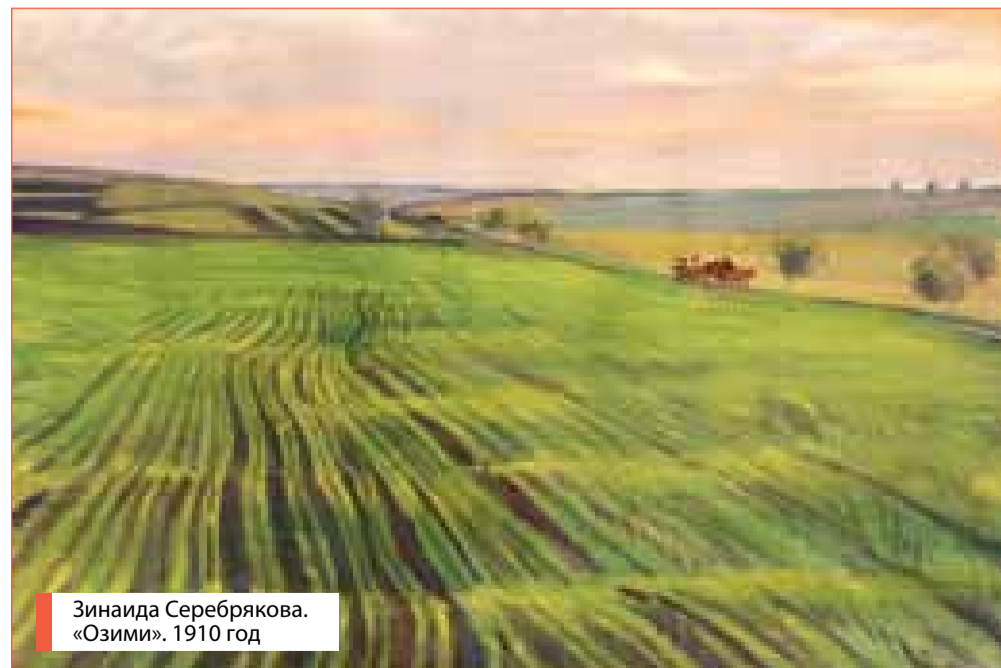
Зинаида Серебрякова. «Озими». 1910 год