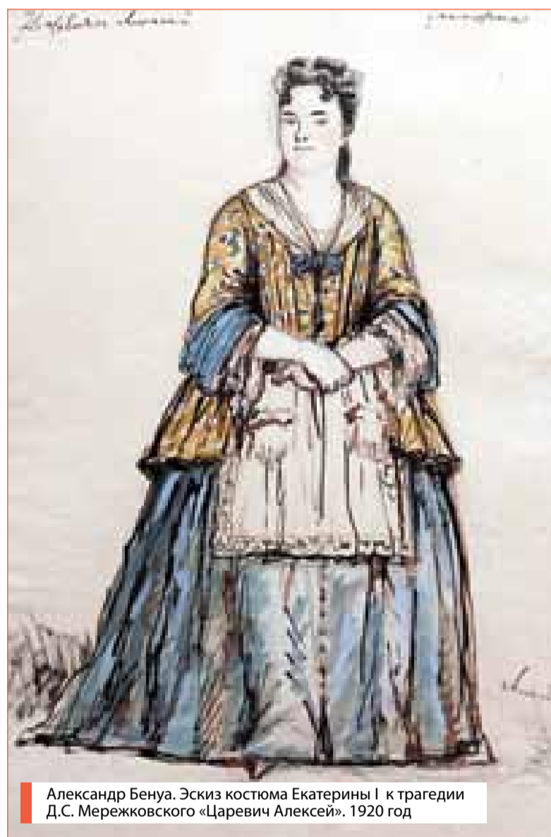
Александр Бенуа. Эскиз костюма Екатерины I к трагедии Д.С. Мережковского «Царевич Алексей». 1920 год