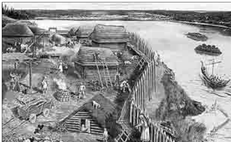
► Проект зоны отдыха на берегу Волги ▼ Реконструкция Попадьинского селища