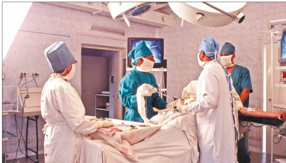
▲ Во время видеоэндоскопической операции в Ярославской ЦРБ

Подготовил Виктор ШТЫГЕВ, главный специалист-эксперт группы по работе с личным составом Ярославского ОМВД России