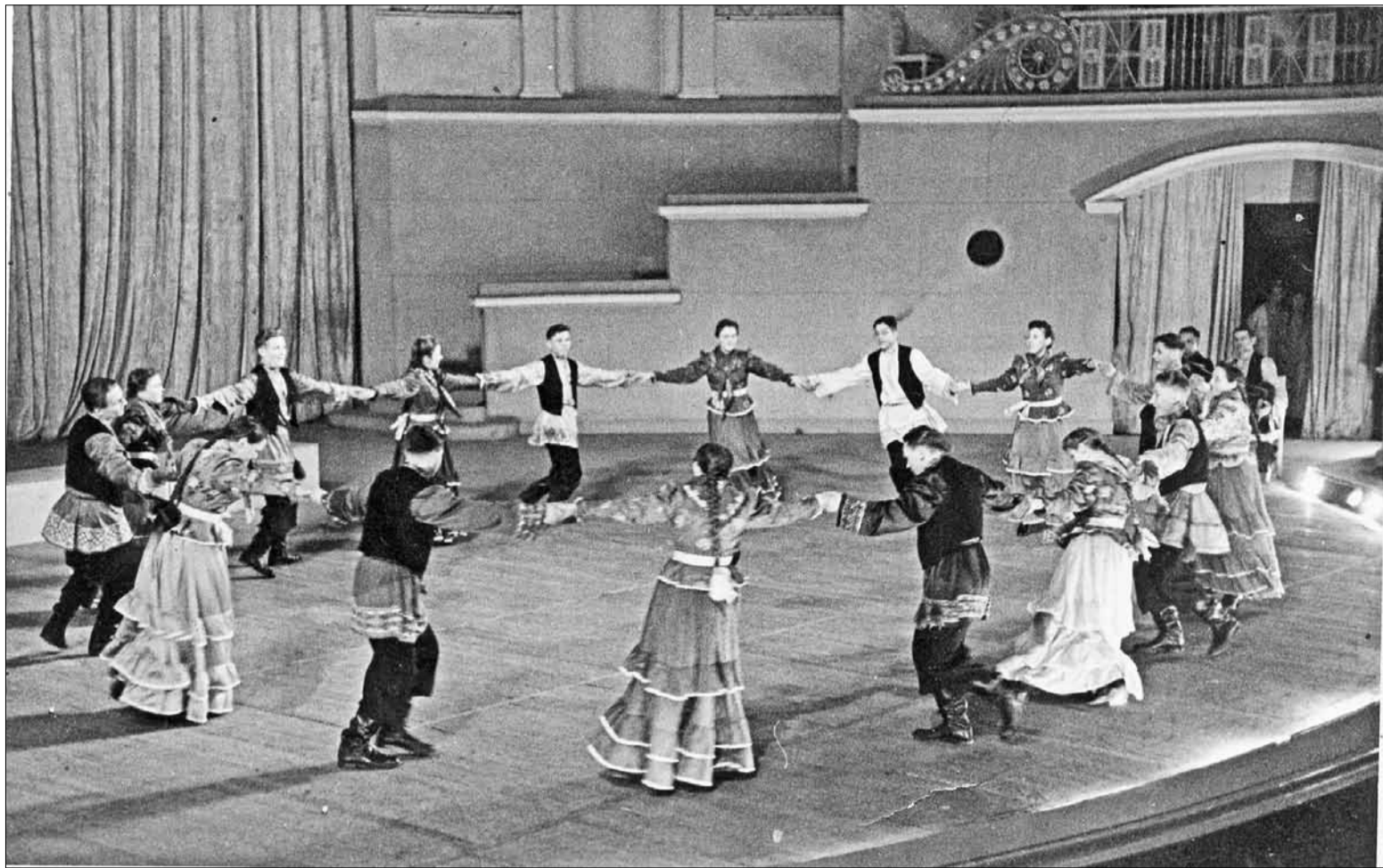
▲ Давыдковская кадрили на сцене Большого театра (1948 г.)