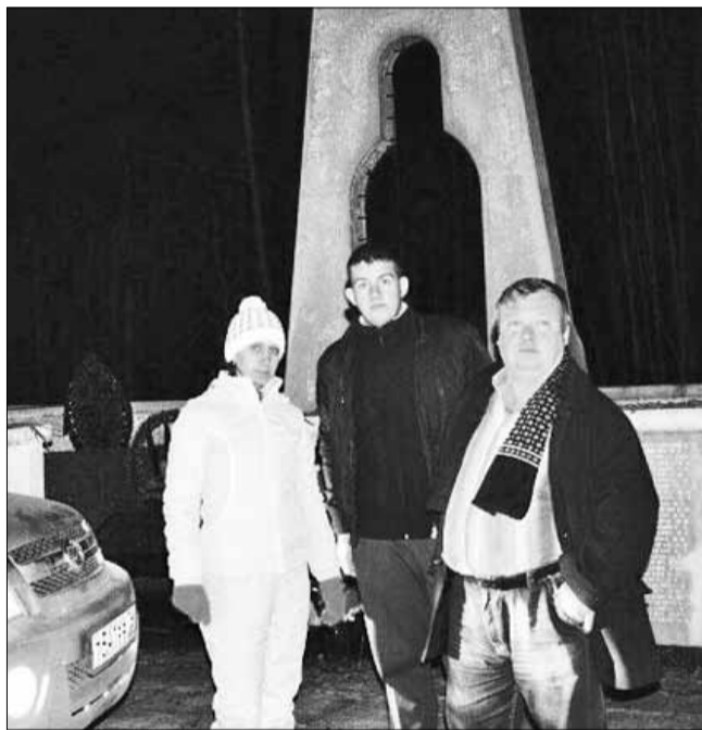
▲ Команда «Русичи» у мемориала жертвам репрессий