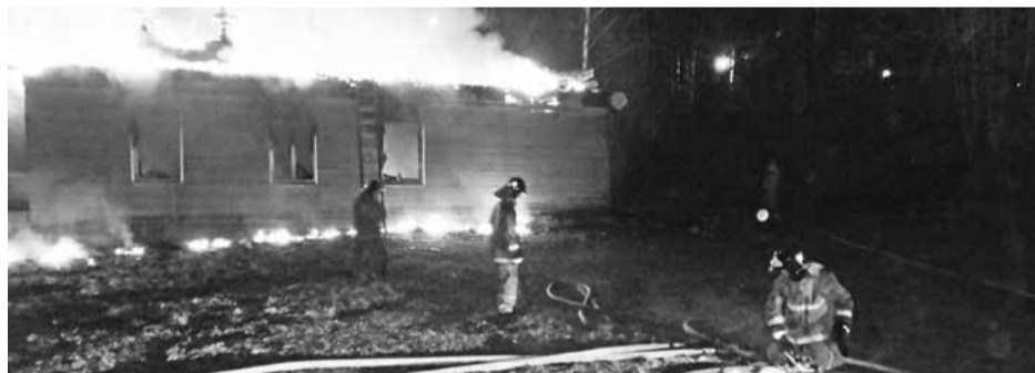
▲ Пожар в парк-отеле «Ярославль»