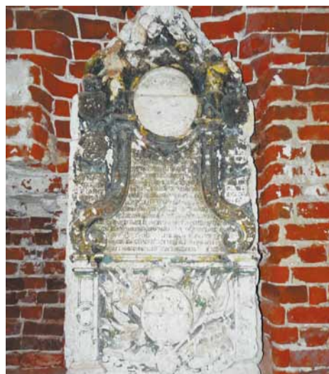
▲ Белокаменная плита с родовым гербом Щербатовых

Начало рассказа о селе Михайловском – в предыдущем номере