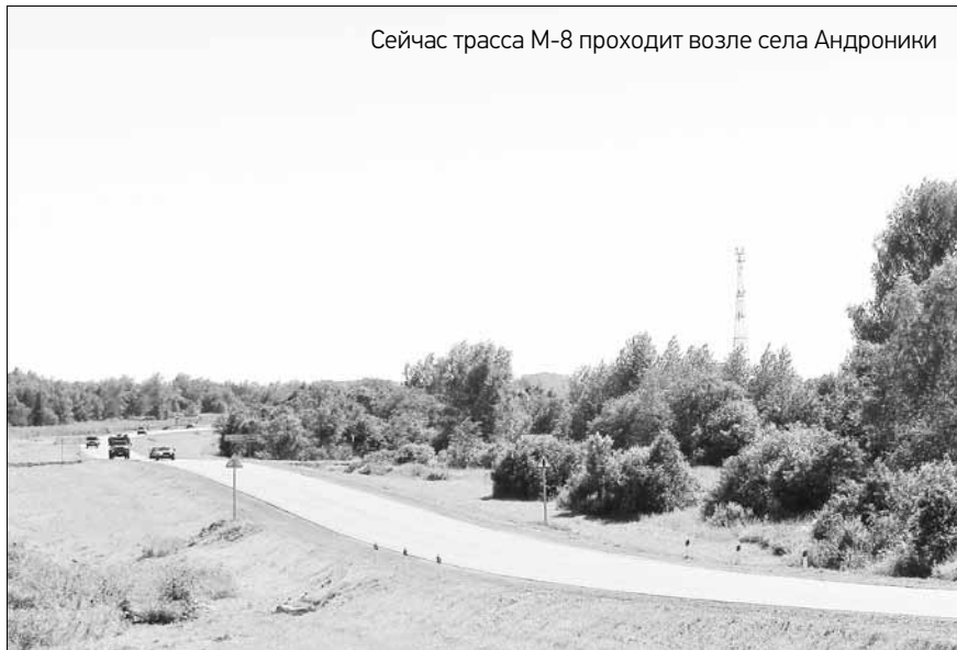
Сейчас трасса М-8 проходит возле села Андроники