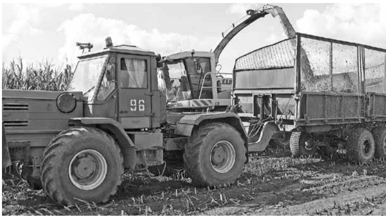
СТР. 1 →

На территории Ярославской области продолжается борьба с африканской чумой свиней. Чтобы справиться с угрозой, начался отстрел кабанов сверх квоты. В районе села Ширинье Курбского СП руководители областного охотхозяйства и егери планируют разредить поголовье диких кабанов. Дело в том, что в конце лета в поисках корма животные могут заходить в населенные пункты и контактировать с домашними свиньями. Поэтому сейчас охотники стараются отстреливать парнокопытных во избежание распространения АЧС. Селезенку подбитого кабана отправляют на анализ, остальную тушу сжигают на специальной территории.