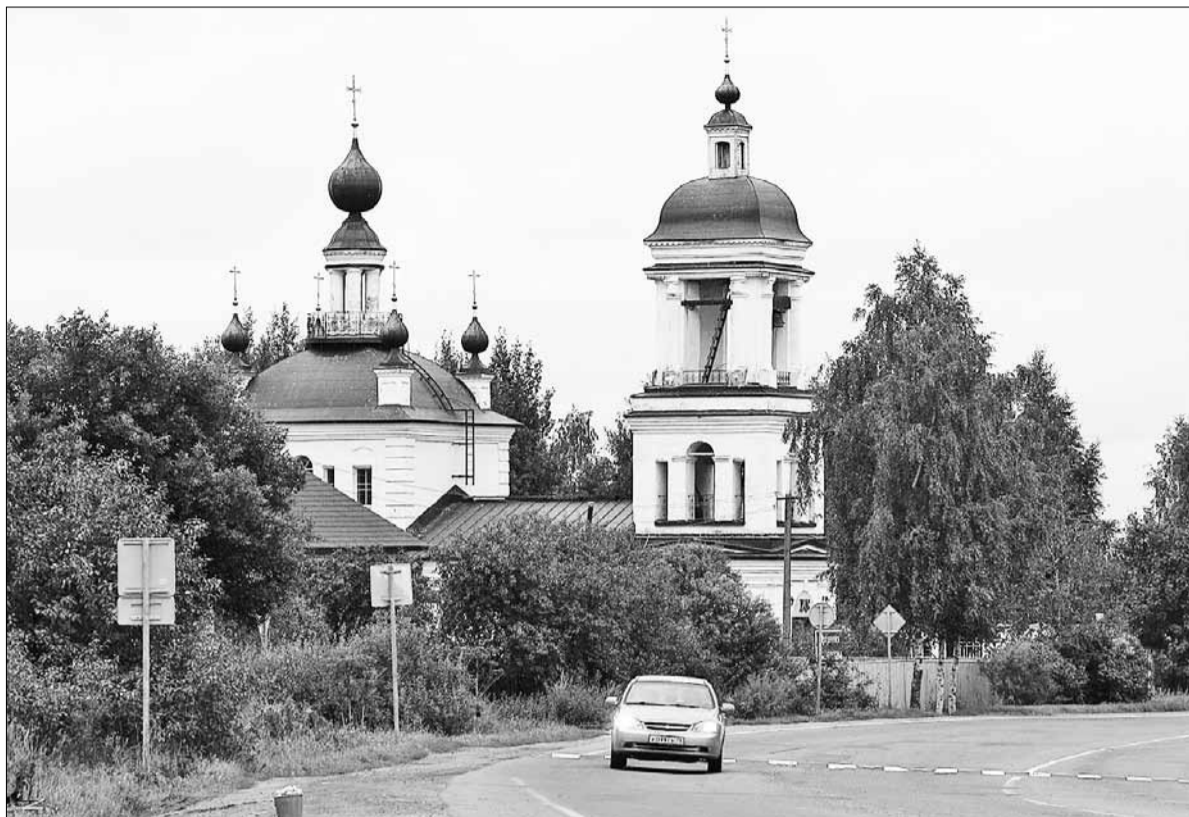
Храм Рождества Пресвятой Богородицы в Григорьевском, построенный в 1809 году