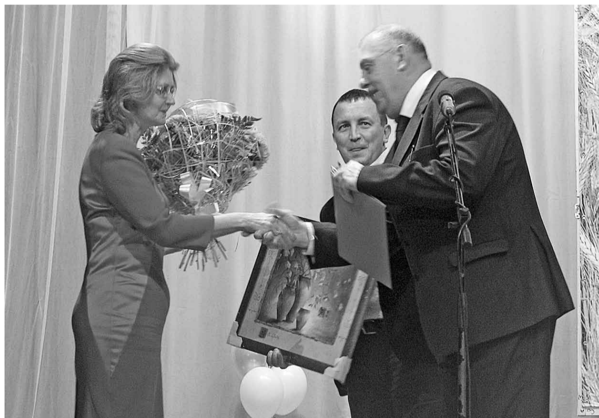
▲ Поздравление от вологжан

Вообще-то День работников сельского хозяйства и перерабатывающей промышленности отмечается во второе воскресенье октября, но в это время в нашей полосе сельскохозяйственные работы еще продолжаются. Чтобы не отвлекать людей от дел, районный праздник отмечается несколько позднее, в этом году – 25 октября.