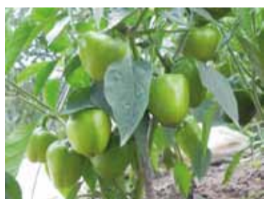
КУРБСКИЕ ПЕРЦЫ О. ДУБИЧЕВ