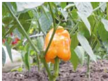
ОРАНЖЕВОЕ ЧУДО О. ДУБИЧЕВ