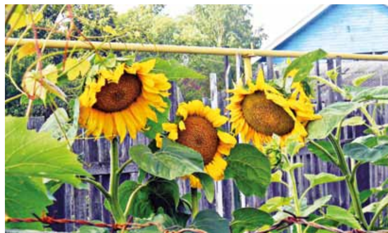
ТРИ ДЕВИЦЫ ПОД ОКНОМ СЕРГЕЙ КОНСТАНТИНОВ, П. ДУБКИ

Участуйте в нашем конкурсе «Фото с огорода», присылайте интересные и необычные снимки с ваших приусадебных участков. По итогам конкурса победителя ждет ценный приз.