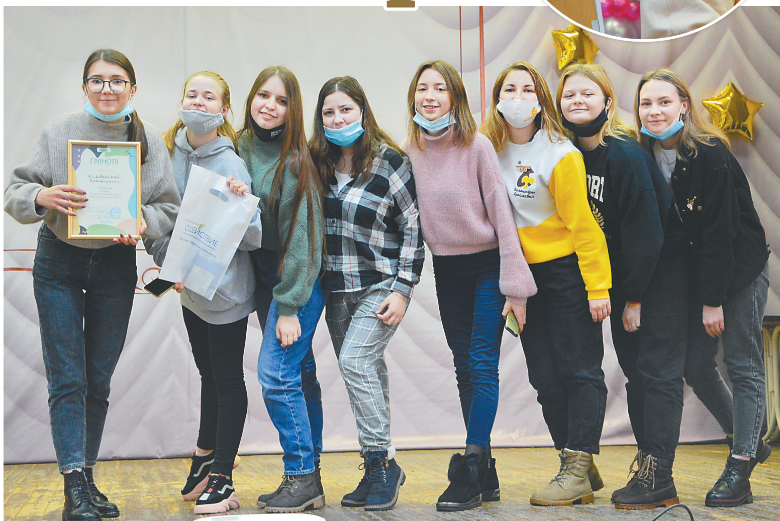
На базе лечебно-оздоровительного комплекса «Сахарож» состоялся III волонтерский форум Ярославского района. Его кульминацией стал конкурс волонтерских отрядов. Лучшим признан – «Добрые руки» Заволжского СП.