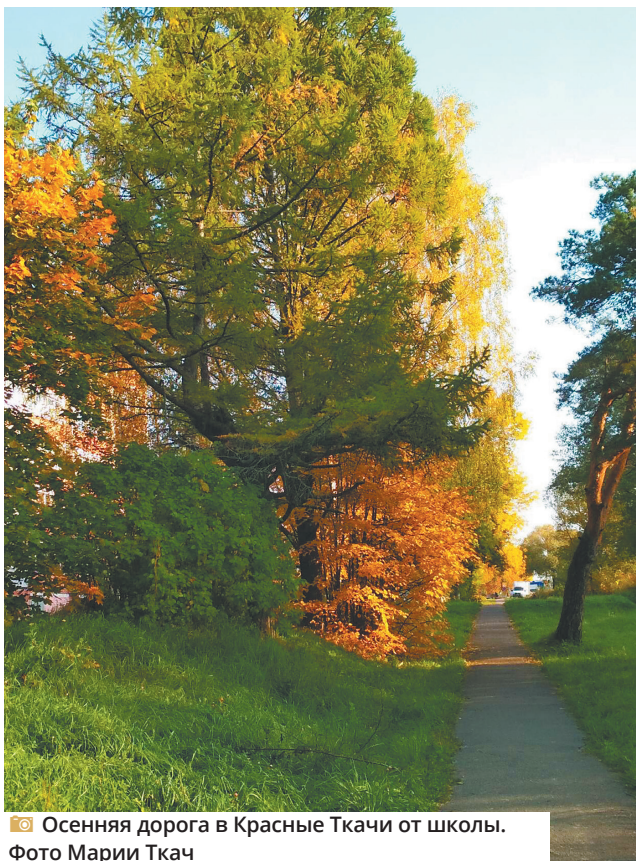
Осенняя дорога в Красные Ткачи от школы.