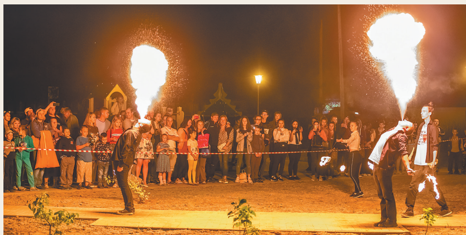
Жизнь района в объективе Светланы Бурцевой