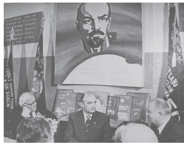
Визит М.С. Горбачева в «Горшиху»

Убежден, что в Медягине нужно увековечить память этого выдающегося человека.