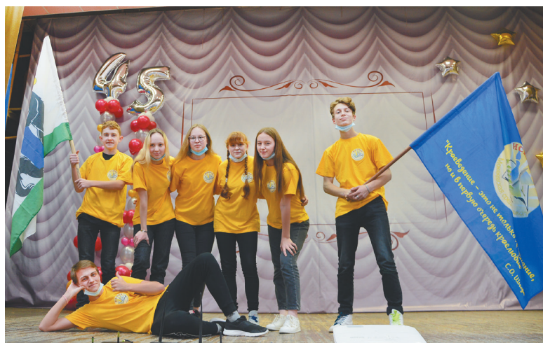
Отряд «Искатели» на сцене

Участники конкурса презентовали деятельность отрядов за 2020 год. Жюри по достоинству