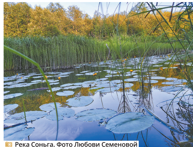
Река Соньга.

2021 года и подарочный экземпляр изданного нашей редакцией к 90-летию ЯМР сборника «Земля и люди. Агропромышленный комплекс Ярославского муниципального района: вчера, сегодня, завтра!».