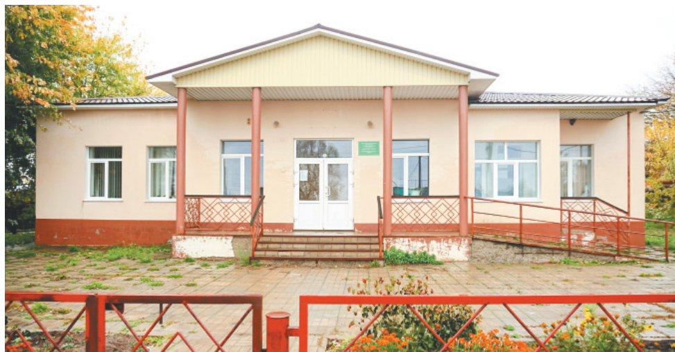
Амбулатория в поселке Заволжье