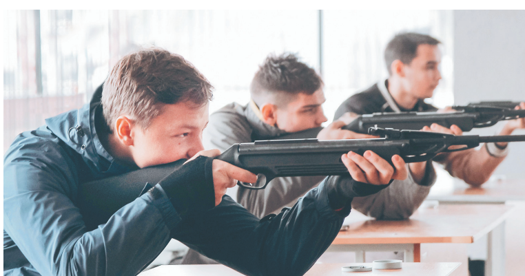
Соревнования по стрельбе из пневматической винтовки