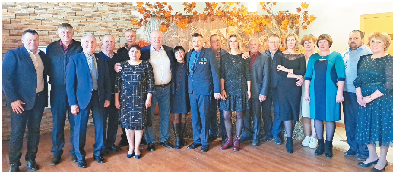
Участники районного праздника в честь Дня работника сельского хозяйства и перерабатывающей промышленности

грунта свыше 300 ц/га. Всего собрано зерна и зернобобовых культур 28 тысяч, а картофеля 13 тысяч тонн.