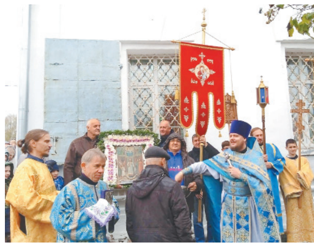
Крестный ход в праздник Покрова Пресвятой Богородицы