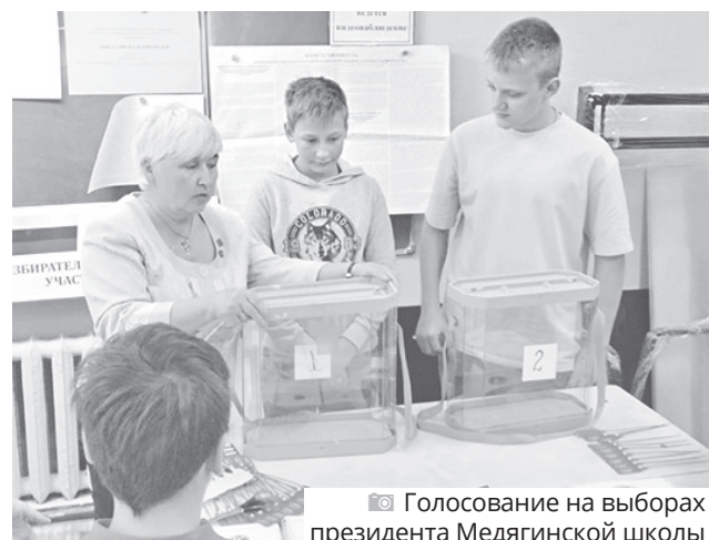
Голосование на выборах президента Медягинской школы

Голосующие отметили сплоченность жителей ЯМР. Спасибо, что вы отдали свои голоса за нашу школу! Благодарим обучающихся и педагогов Кузнецкихинской, Пестрецовской, Григорьевской, Толбухинской, Глебовской, Спасской школ, которые тоже помогли обеспечить победу!