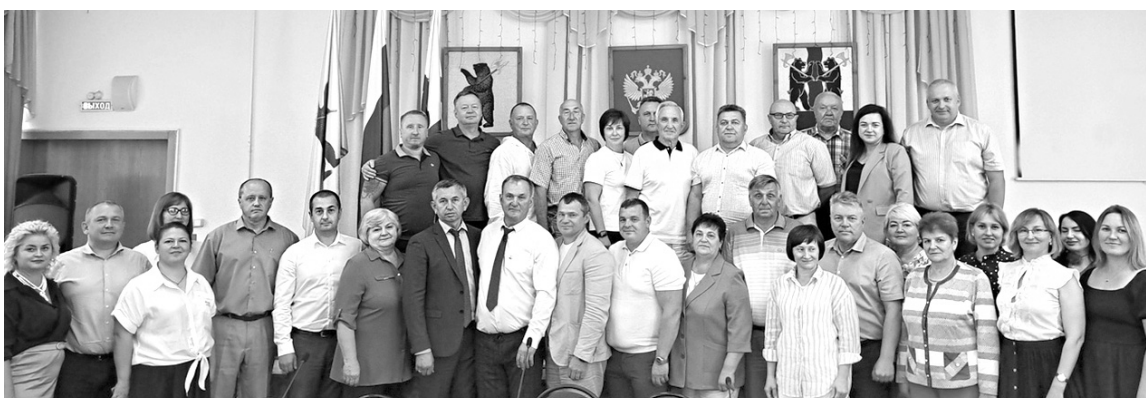
Участники завершающего заседания Муниципального совета ЯМР 7 созыва