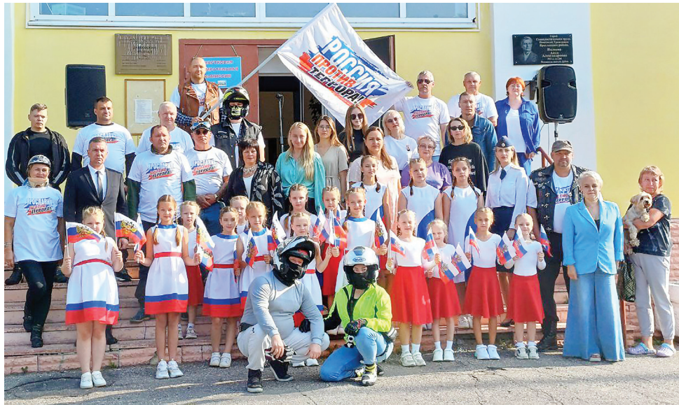
На старте в поселке Дубки

Колонна в составе более чем двух десятков мотоциклов и автомашин двигалась по маршруту: поселок Дубки – поселок Ивня-