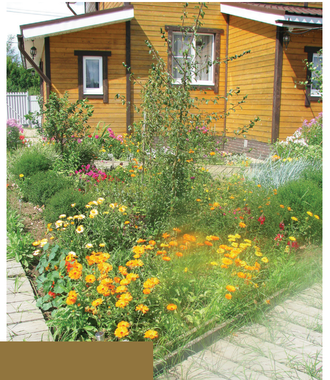
Клумбы и деревянные тротуары