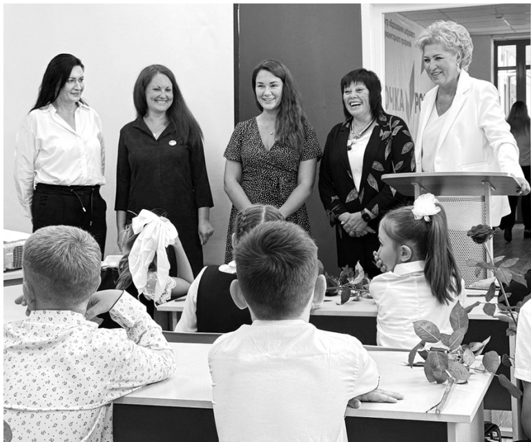
Почетные гости в школе п. Ярославка