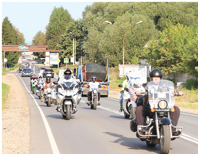
На трассе мотоавтопробега