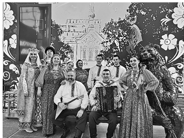
Представители Ярославского района на выставке-форуме «Россия»

В рамках подпрограммы «Профилактика правонарушений» изготовлена и распространена наглядная агитация по профилактике терроризма и экстремизма; выплачено денежное вознаграждение народным дружинникам Ивняковского, Туношенского, Некрасовского сельских поселений и городского поселения Лесная Поляна. В октябре будут подведены итоги курсов среди сотрудников ОМВД России по Ярославскому району – «Лучший участковый (старший участковый)