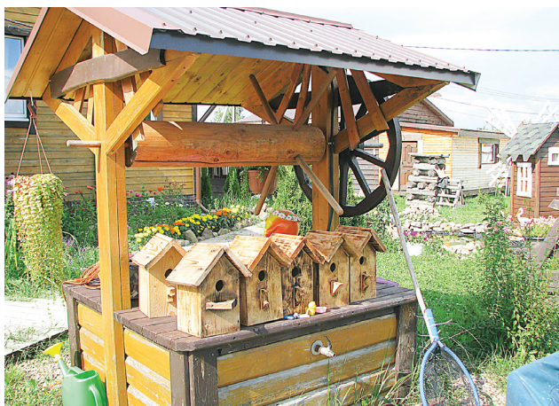
Плоды трудов хозяев радуют глаз

Староста предложил жителям внести средства для покупки фо-