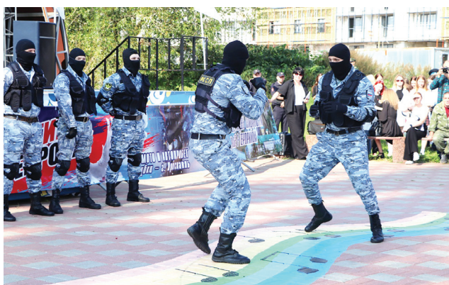
Сотрудники УФСИН показали мастерство

В финальной точке маршрута, возле КЗЦ «Миллениум», состоялось комплексное мероприятие с выставкой спасательной и военной техники, множеством интерактивных площадок и социальная акция «Мы вместе приходим на помощь», в рамках которой для посетителей была открыта площадка спецтехники силовых структур региона. Действовали интерактивные площадки для детей. Их посетили и школьники Ярославского района.