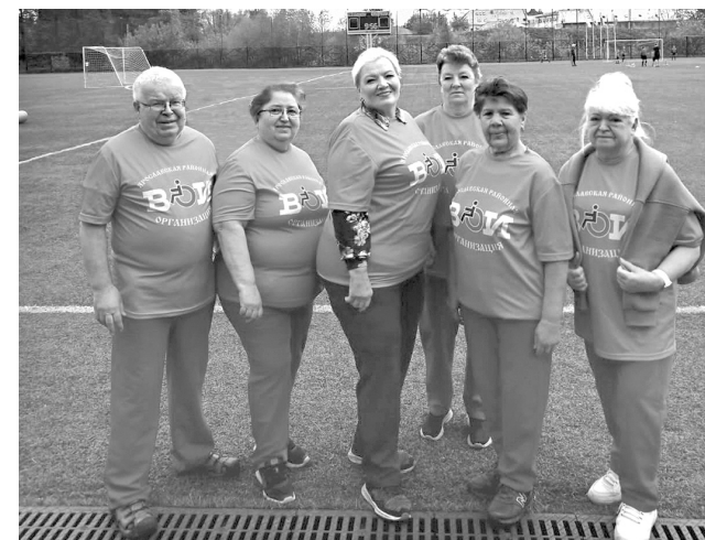
Не стареют душой ветераны