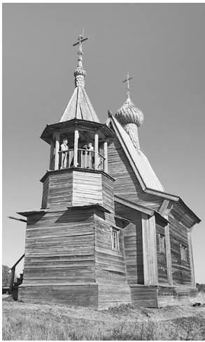
Часовня Николая Чудотворца в деревне Вершинино