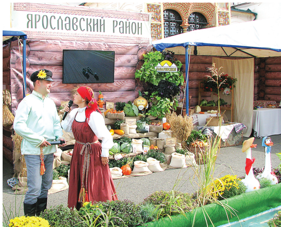
Экспозиция Ярославского района