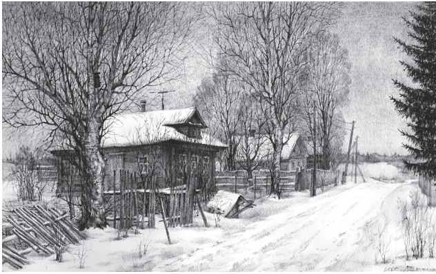
«Деревня Филисово. Зима»