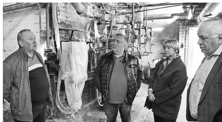
Депутаты областной Думы в котельной п. Красные Ткачи

В октябре депутаты вернутся к вопросу подготовки объектов к зиме.