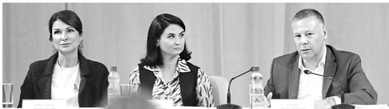
Губернатор Ярославской области М.Я. Евраев проводит пресс-конференцию

Губернатору задали вопрос об объединении детских садов и школ в образовательные комплексы. Он ответил, что это необходимая мера. Задача – поднять зарплату младшему персоналу путем объединения и сокращения лишнего административного аппарата. По словам губернато-