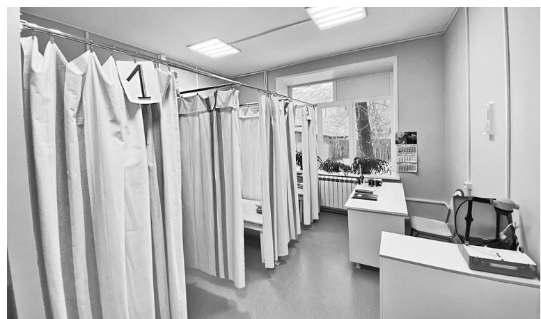
Кабинет физиотерапии после ремонта

Вечер получился добрым и веселым. Атмосферу в зале подогревали художественные поздравления самодеятельных артистов Туношенского дома культуры.