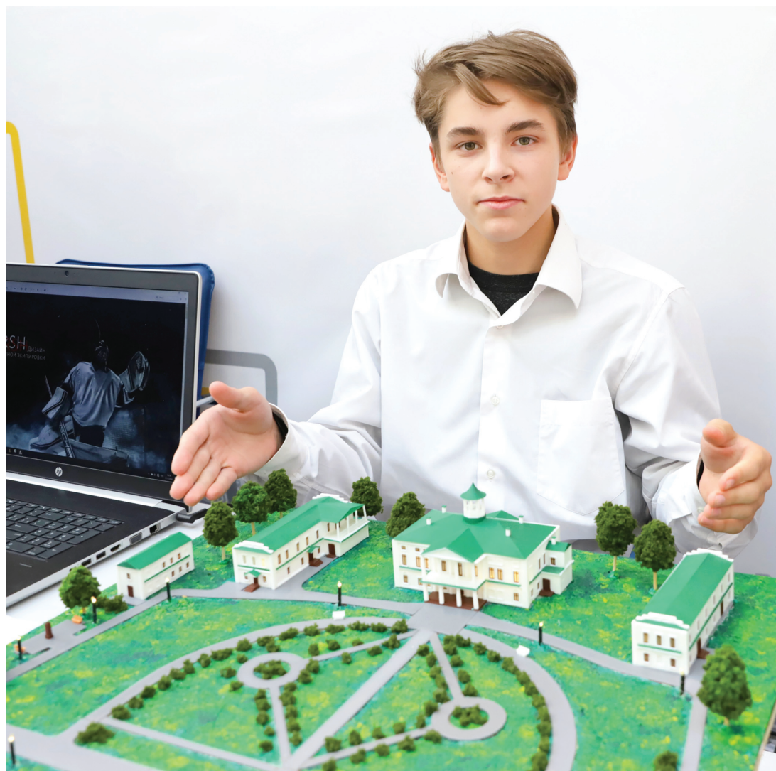
© Артем Кряквин с частью макета усадьбы «Карабиха»