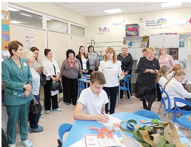
Идет обмен знаниями