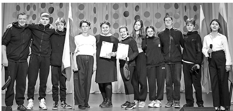
Команда села Спас-Виталий

Первое место завоевала команда села Спас-Виталий, второе – деревни Григорьевское, третье – поселка Заволжье, четвертое – деревни Пестрецово.