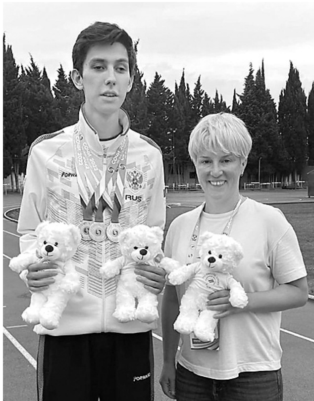
☞ Гроссмейстер И. Смурков и Н.И. Зыкова