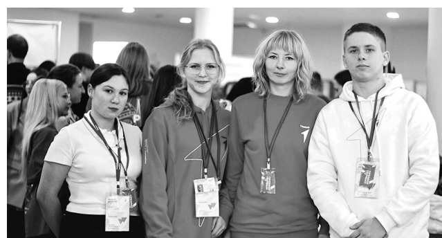
Представители Ярославского района на региональной конференции «Движения Первых»