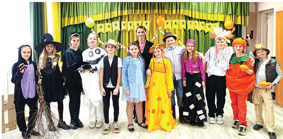
Школьный театр на английском языке «Волшебный занавес»

и эстрадного танца для школьников и даже их семей.