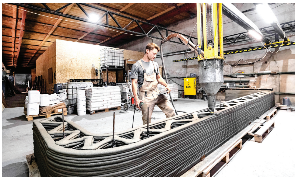
Процесс изготовления деталей здания на принтере в цеховых условиях