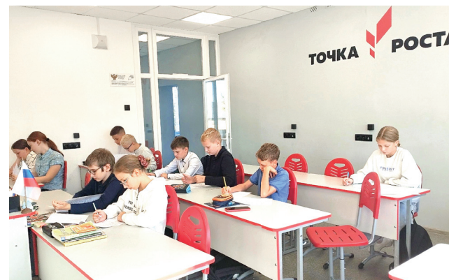
На уроке в Точке роста