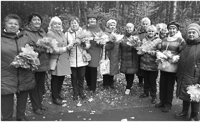
Команда Ярославского района

Внимание миллионов граждан привлечено к проблемам людей, попавших в непростую жизненную ситуацию. В нашей области около 140 тысяч инвалидов, и большинство из них нуждаются в особой под-