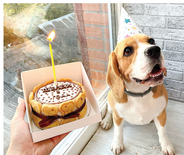
Лакомство для питомца