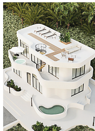
📷 Здание, построенное методом 3D-печати

📷 Печать дома на строительном принтере в деревне Черелисино