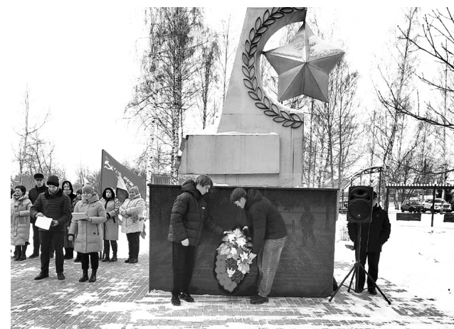
Памятник в селе Спас-Виталий

Минутой молчания собравшиеся почтили земляков, погибших на фронтах Великой Отечественной войны, и возложили цветы к плитам мемориала. А творческие коллективы Спас-Витальевского дома