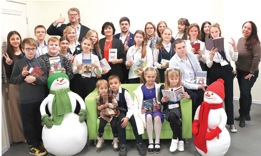
Участники конкурса чтецов