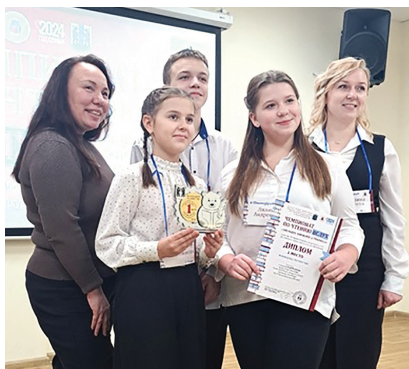
Команда «Фантазеры» - победители

Антон Белов