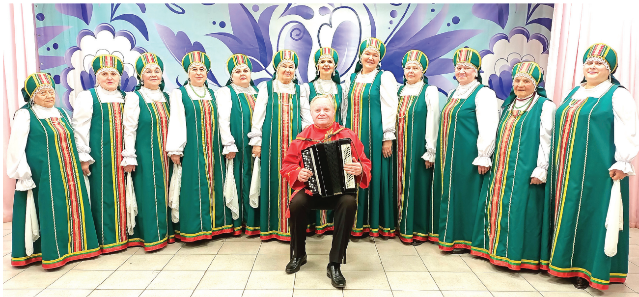
Вокальный коллектив «Щедровочка»

«Щедровочка» – активный участник фестивалей, праздничных мероприятий и конкурсов. В 2018 году коллектив получил диплом лауреата