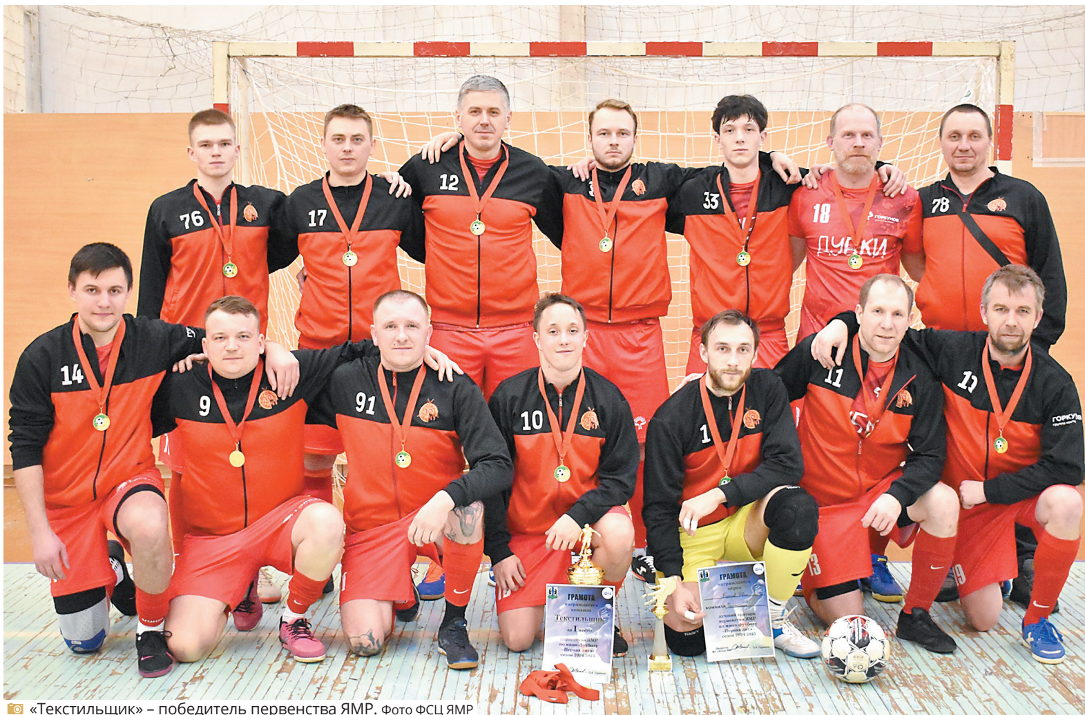
«Текстильщик» – победитель первенства ЯМР.