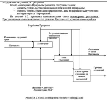
Рисунок 6.2. Схема мониторинга результатов Программы

На рисунке 6.2. приведена принципиальная схема мониторинга результатов Программы социально-экономического развития Ярославского муниципального района.