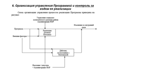
Рис. 6.1. Схема организации управления процессом реализации Программы. Координация всех действий отделов Администрации и других участников выполнения Программы осуществляется управлением социально-экономического развития района

Схема организации управления процессом реализации Программы приведена на рисунке: