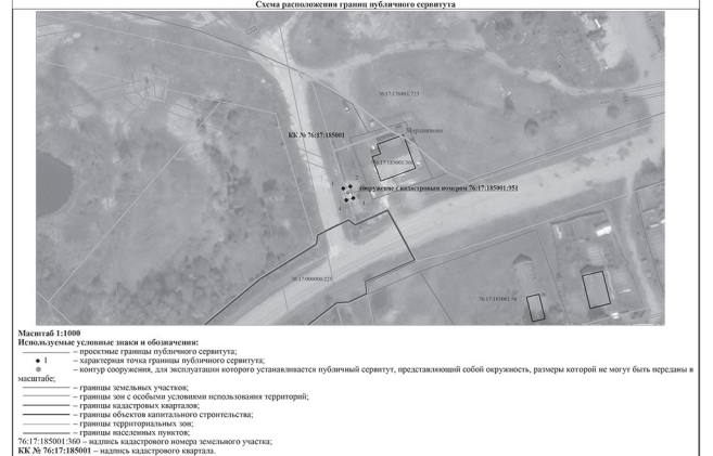
Графическое описание местоположения границ публичного сервитута, устанавливаемого на период эксплуатации сооружения с кадастровым номером 76:17:185001/951 (антенно-мачтовое сооружение связи) Система координат: МСК-76, Зона I