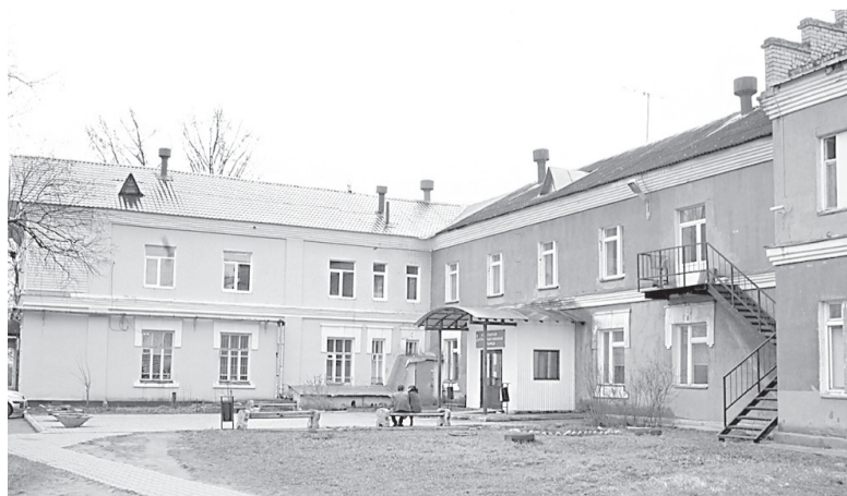
Стационар ЦРБ в Карабихе

– Постараться привлечь дополнительные объемы для паллиативной помощи. Решить вопросы с организацией медицинской помощи в Красном Бору, а также проблему нового здания детской поликлиники в Карабихском сельском поселении. От этого во многом будет зависеть качество жизни земляков.