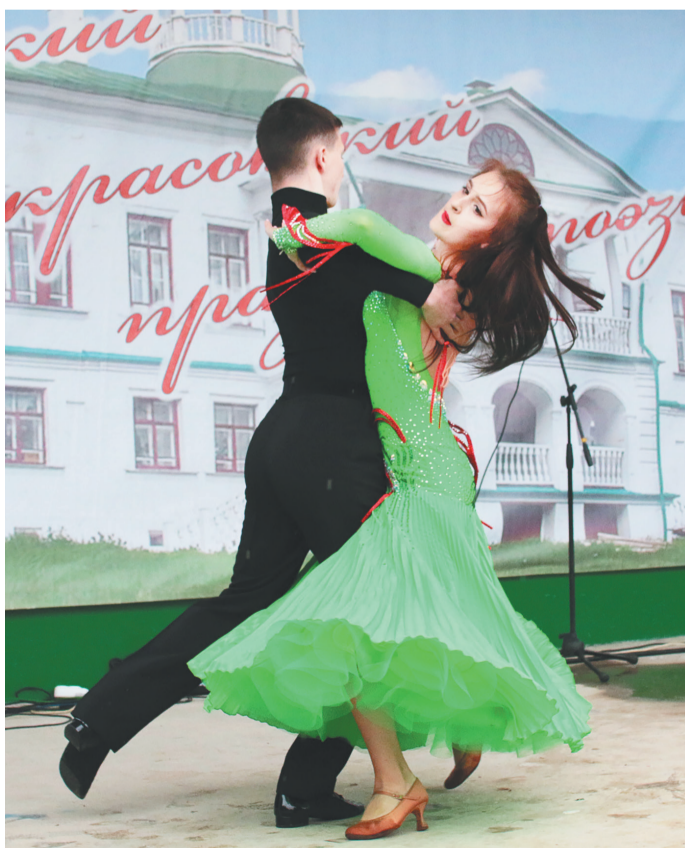
☞ Торжественное открытие праздника