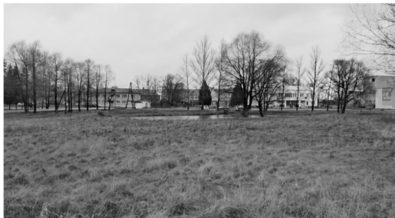
Парк в селе Туношна. Так было...

Дворовые территории везде преобразовывали комплексно: провели не только асфальтирование, но и озеленение, освещение, установили малые архитектурные формы, прежде всего детские площадки. Этот принцип взят на вооружение и в нынешнем году. Все восемь поселений приняли участие в работах. В Заволжском и Курбском удалось завершить по два,