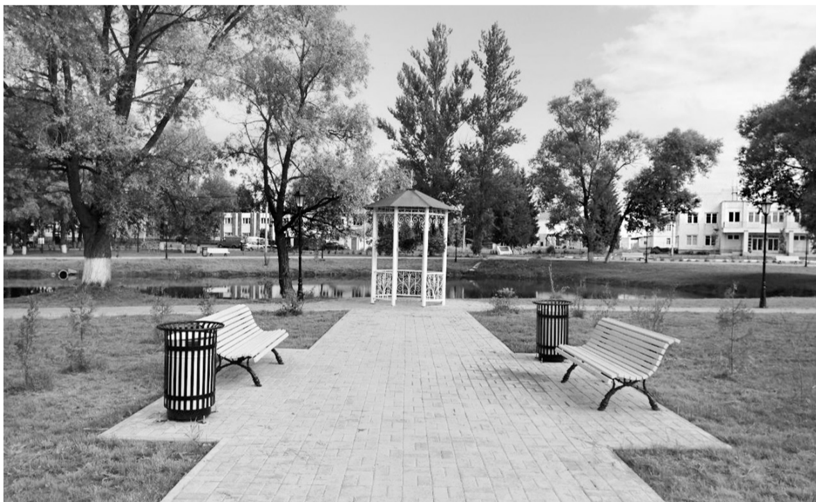
... так стало