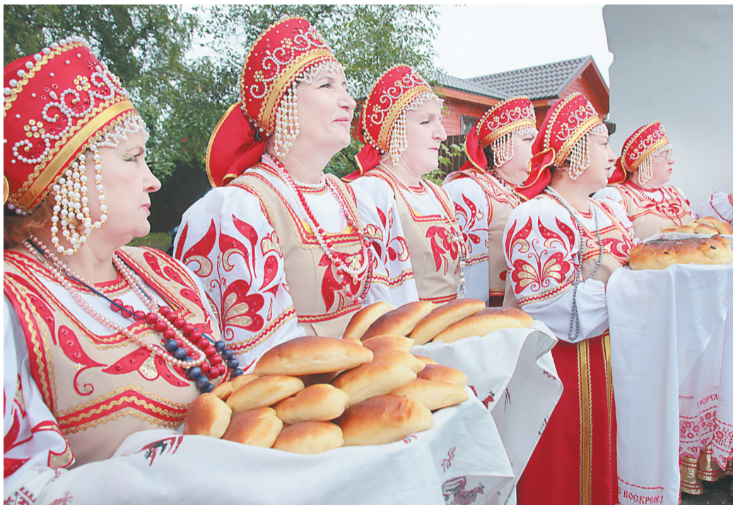
☞ Добро пожаловать в Карабиху!