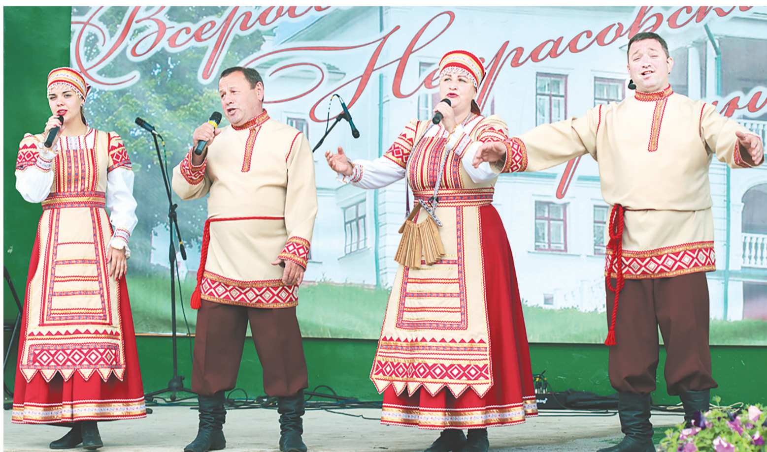
▶ В минувшую субботу в Карабихе прошел 52-й Некрасовский праздник поэзии. Читайте на стр. 8-9