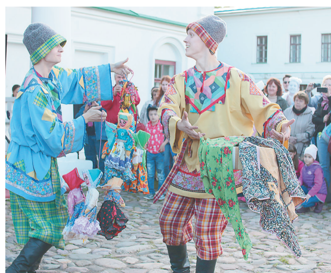
☞ Герои произведений Некрасова – веселые коробейники