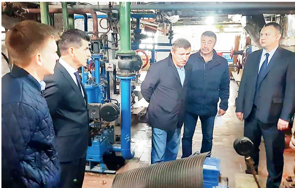
Участники совещания по подготовке ЖКХ к зиме – на объекте

В 2019 году завершено строительство повысительной насосной станции и присоединение водопроводных сетей п. Ярославка ЯМР к водопроводным сетям АО «Ярославльводоканал». Стоимость строительства составила 5,3 млн руб.