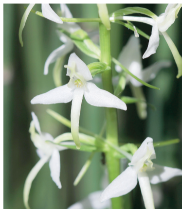
● Любка двулистная, или ночная фиалка

готовили приворотное зелье. В Ярославском районе цветение любки двулистной – ночной фиалки – зафиксировано биологами в одиннадцати местах.