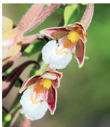
● Орхидея дремлик болотный

Во второй половине лета цветет любка зеленоцветковая. Она очень похожа на свою двулистную родственницу, но не обладает сильным ароматом, и