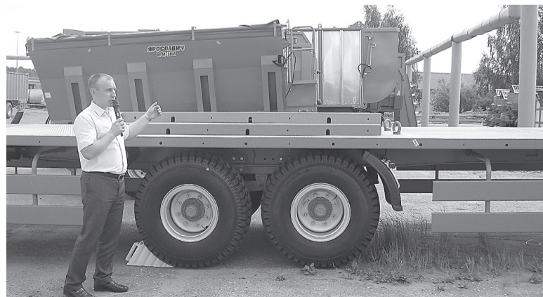
Распределитель минеральных удобрений производства ПК «Ярославич» предназначен для поверхностного внесения в почву минеральных удобрений, в том числе доломитовой муки с целью раскисления почвы и повышения урожайности

Известкование – метод химической мелиорации кислых почв, заключающийся во внесении в них известковых удобрений: кальцита, доломита, известняка, отходов сахарного производства, гашеной извести и других. В результате известкования в почве в 2 – 3 раза увеличивается количество разлагающихся органические вещества микроорганизмов, в 5 – 9 раз – нитрифицирующих бактерий. Известкование повышает подвижность калия, магния, молибдена, снижает подвижность бора, меди, цинка. Продолжительность действия полной нормы известки на разных почвах составляет 5 – 15 лет.