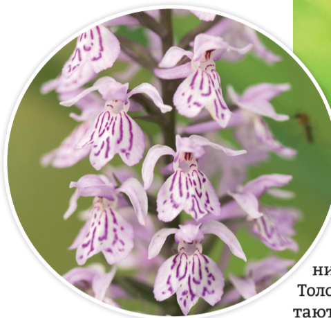
● Орхидея дремлик широколистный

никогда не бывает зеленой. Толстые корни гнездовки сплетаются в клубок, похожий на птичье гнездо. Вот откуда русское название этой странной орхидеи. Плоды гнездовки – эллиптические коробочки. Как и у других орхидей, семян в них созревает немислимое количество, а размерами они как пылинки. Гнездовка – растение-сапрофит. По способу питания она схожа со шляпочными грибами, которые растут на почве в лесах. Она не нуждается в солнечном свете так, как зеленые растения, а живет, как и грибы, за счет разложения гниющих остатков растений в верхних слоях почвы.