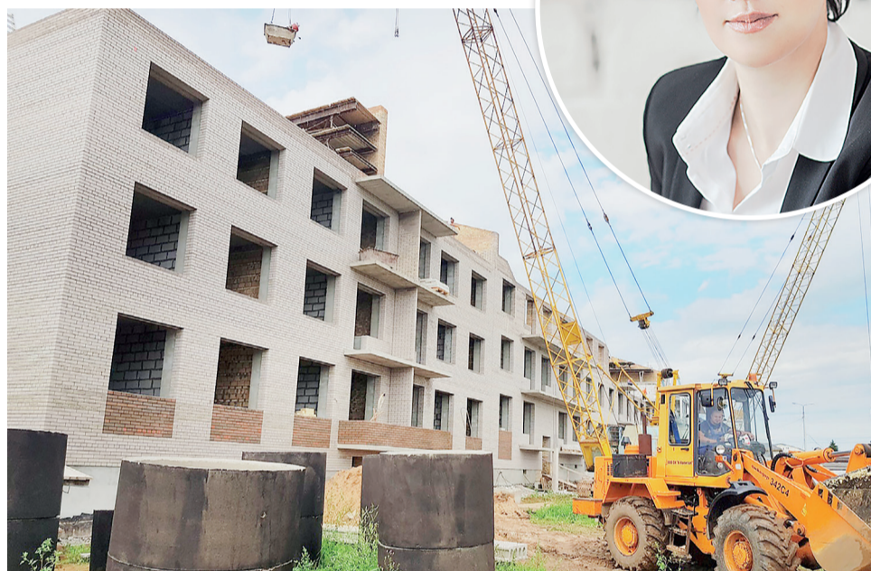
Ярославский район строится