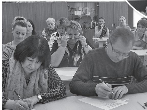
Участники диктанта отвечают на вопросы

Первого ноября в преддверии Дня народного единства в Красноткацкой средней школе прошла Международная просветительская акция «Большой этнографический диктант».