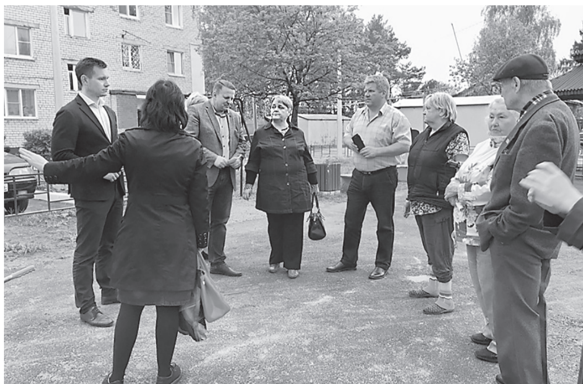
В Ярославском муниципальном районе организован контроль качества работ на объектах благоустроенных по проекту «Решаем вместе!»

В Тутаевском районе по программе «Решаем вместе!» работали по 35 проектам. В их числе – восемь дворовых территорий, два общественных пространства и 25 объектов по поддержке местных инициатив. Что любопытно: большинство проектов было из Константи-