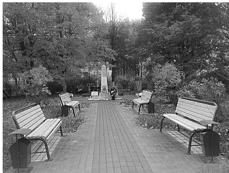
В рамках проекта «Решаем вместе!» благоустроена территория возле памятника в Лесной Поляне

Меня, как художника, жители попросили нарисовать эскиз проекта, из 4-5 вариантов выбрали один. Я руковожу детской изостудией, привлекал ребят, они помогали делать макет, рисовали картинку. Сейчас на очереди обустройство спортивной зоны. Для молодежи она необходима. Думаю, участие в проекте «Решаем вместе!» поможет справиться и с этим делом.