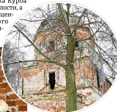
Храм Архангела Михаила

Разговор получился живым, заинтересованным и плодотворным, ведь собрались единомышленники, которые всеми силами стараются сохранить богатейшее историко-культурное наследие. Село Курба – одно из древнейших на нашей родной земле. В XV-XVI веках здесь была вотчина князей Курбских, потомков ярославских удельных князей. В XVIII – начале XX века Курба была центром волости, а в 1944-57 годах – центром отдельного района. На территории Курбско-