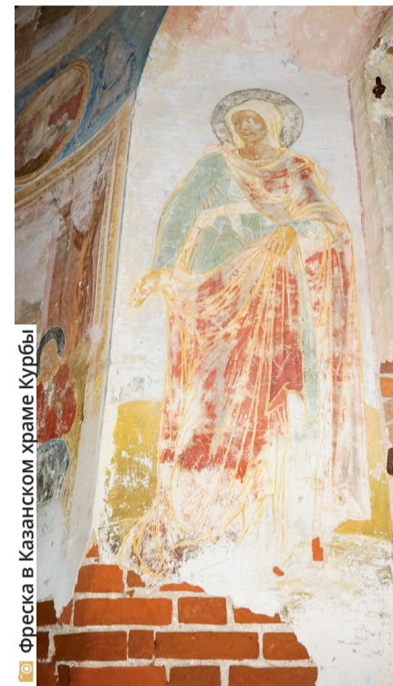
Фреска в Казанском храме Курббы

На круглом столе прозвучало предложение провести экспертизу усадьбы Филимоновых-Калачевых в селе Дегтеве