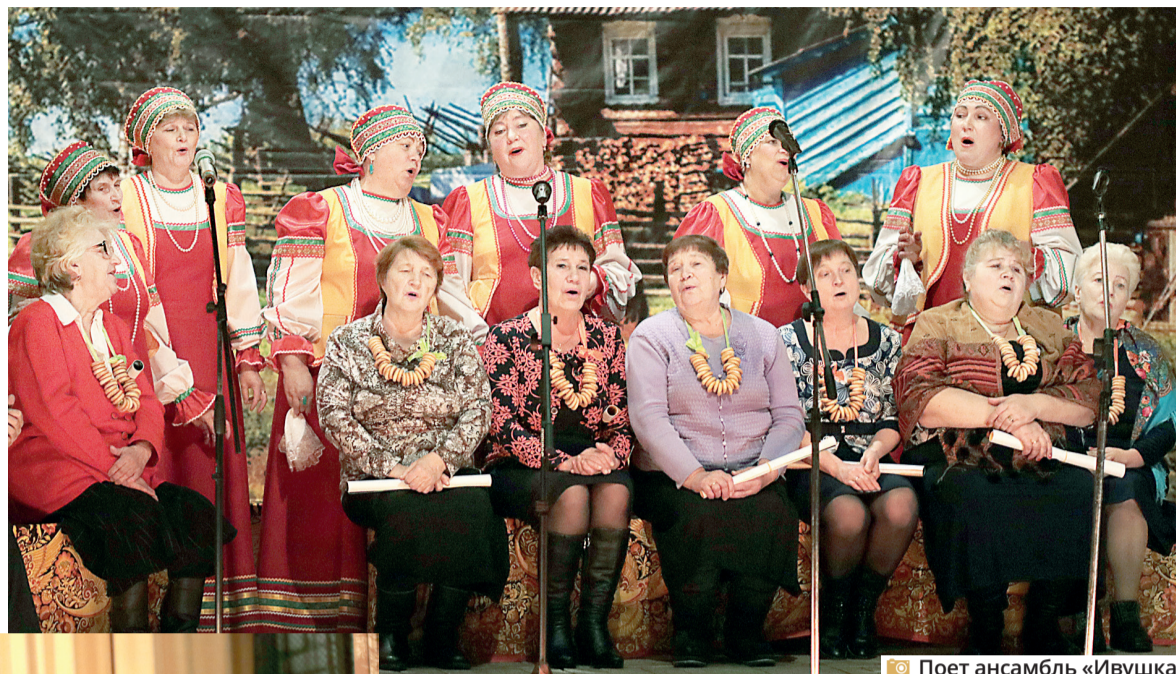
Поет ансамбль «Ивушка»