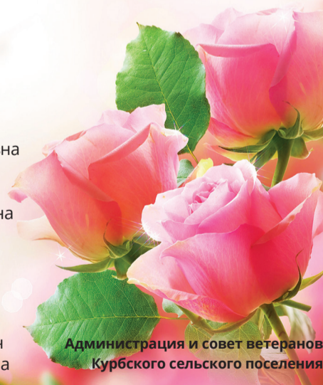
Администрация и совет ветеранов Курбского сельского поселения

Желаем любить и мечтать, Тепло, от души улыбаться, Мновениями бытия Всем сердцем уметь наслаждаться! Ценить все, что жизнью дано, Стараться успеть сделать больше, Дарить счастье, радовать нас И жить в добром здравии долгие!