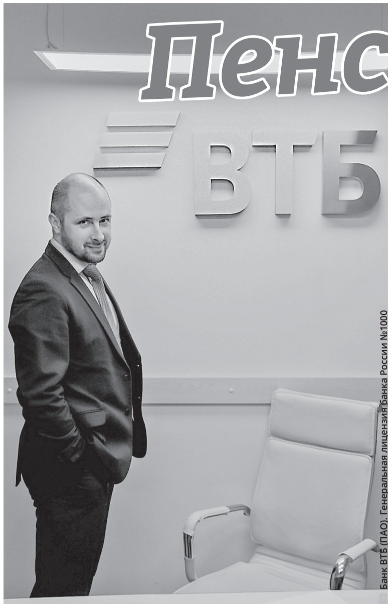
Банк ВТБ (ПАО). Генеральная лицензия Банка России №1000

Полезным результатом подобного подхода являются минимальная кредитная ставка и формирование для пожилых людей льготных условий при потребительском кредитова-