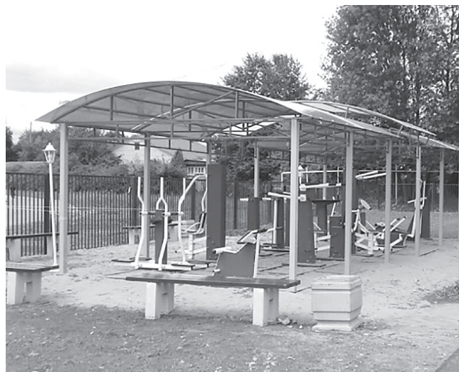
Ремонт площади у дома культуры в селе Сарафонове