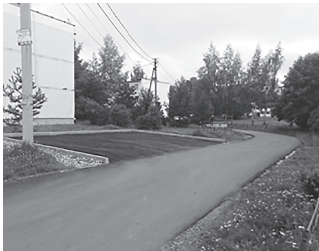
Благоустройство дворовой территории (поселок Щедрино, ул. Парковая)

– В основе проекта лежат гражданские иници-