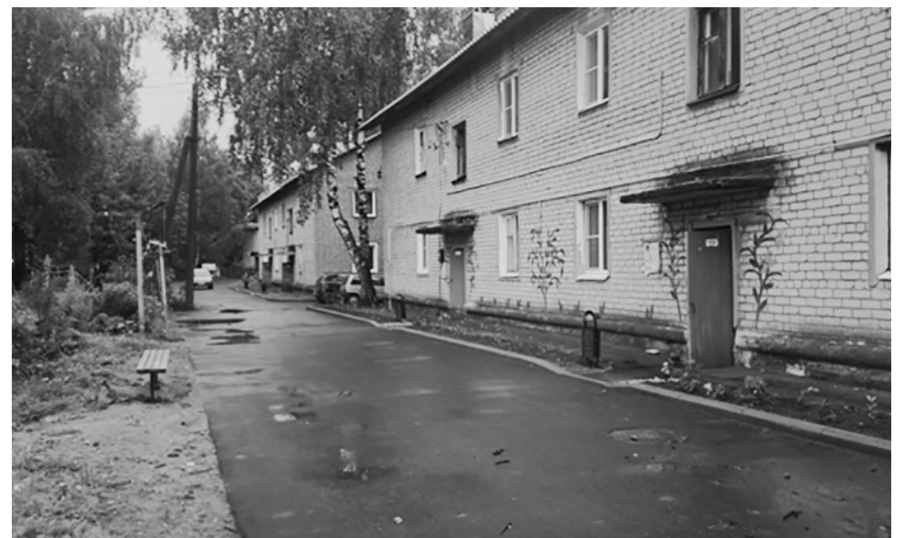
Благоустройство дворовой территории многоквартирных домов (поселок Михайловский, ул. Ленина, д. 29, 31)