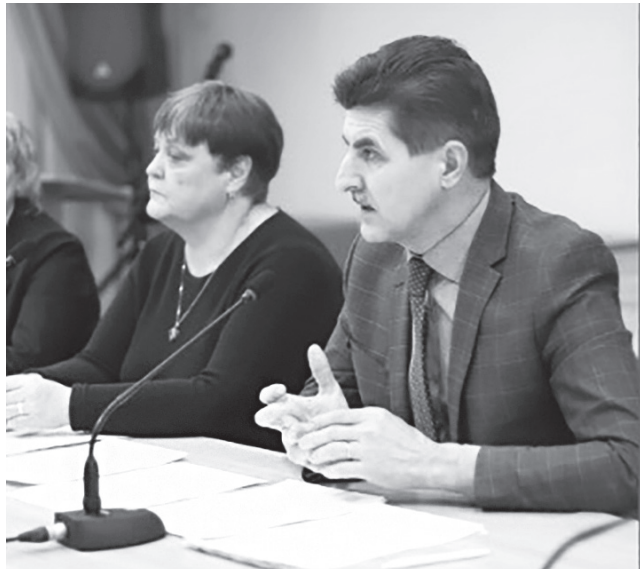
Участники заседания муниципальной общественной комиссии по проекту «Решаем вместе!»

– Губернаторский проект «Решаем вместе!» направлен на выполнение задачи по формированию комфортной городской среды, и для этого в районе делается немало. В 2017 году благоустроены 23 объекта в разных поселениях, 2018 году –