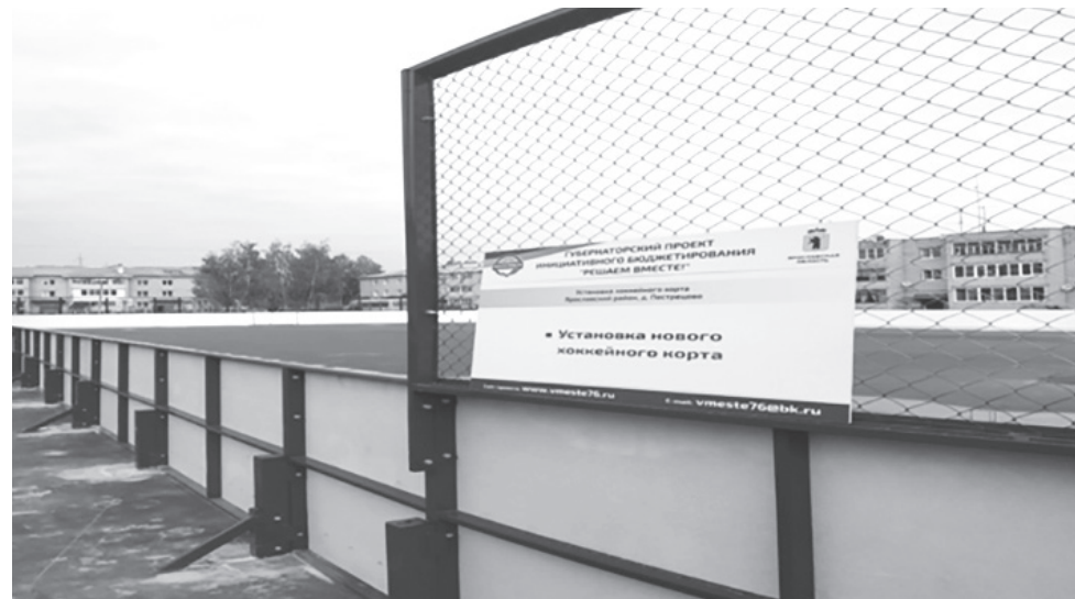
Установка хоккейного корта в деревне Пестрецово