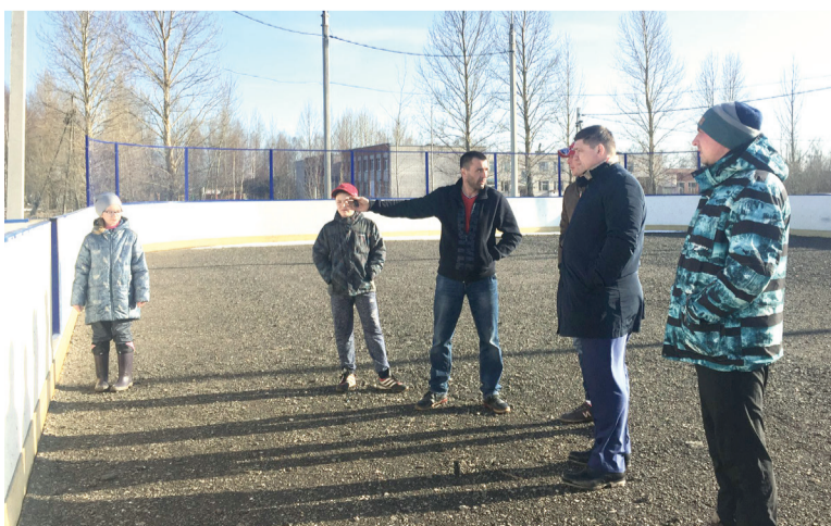
Обсуждение реконструкции хоккейного корта п. Ярославка

сберечь, хочется, чтобы после ремонта эти спортивные сооружения жили не год-два, а дольше.