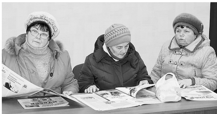
☞ Свежий номер