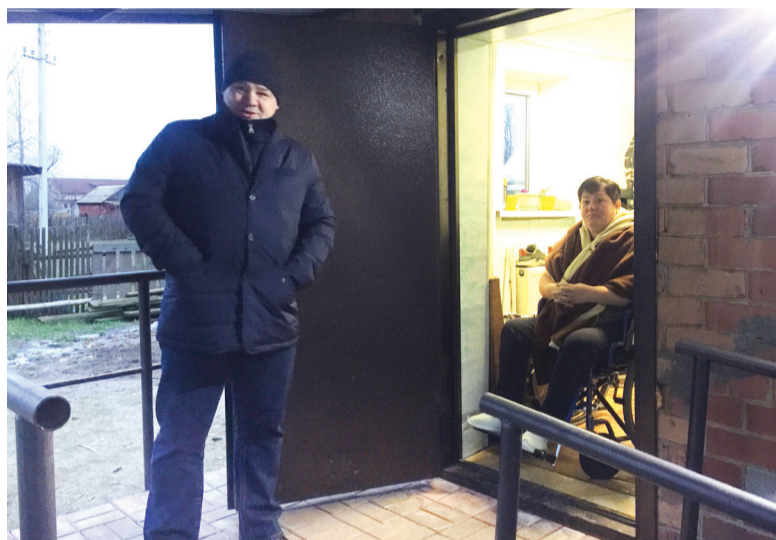
Новые пандус и крыльцо для жительницы Курбы

Летом 2019 года в селе Толбухино появилась тематическая детская площадка «Сказка-малышка» по мотивам русской сказки «Колобок» для детей