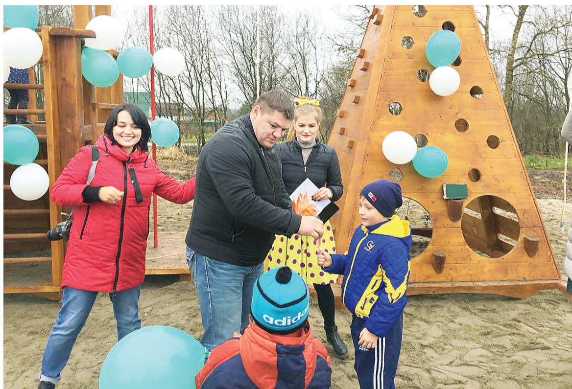
Открытие детского городка «Сказка» в с. Давыдове

Что позволяет статус депутата? Он позволяет увеличить объем помощи, причем помогаю я сегодня не только детям, но и многим взрослым людям, попавшим в сложную ситуацию. А кроме того, вместе с избирателями мы решаем важные для них вопросы. Их в том же Ярославском районе немало: где-то надо школу от-