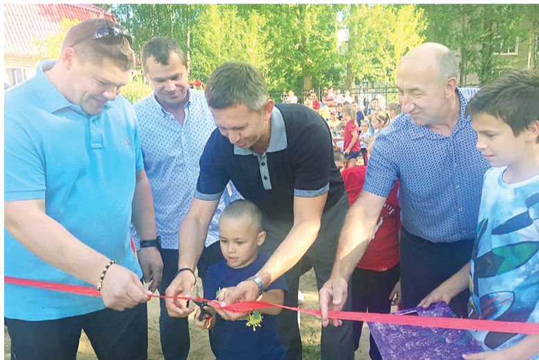
Открытие детского городка в п. Михайловский

А на днях в Курбе в доме одной из моих избирательниц его люди установили пандус, козырек и отремонтировали крыль-