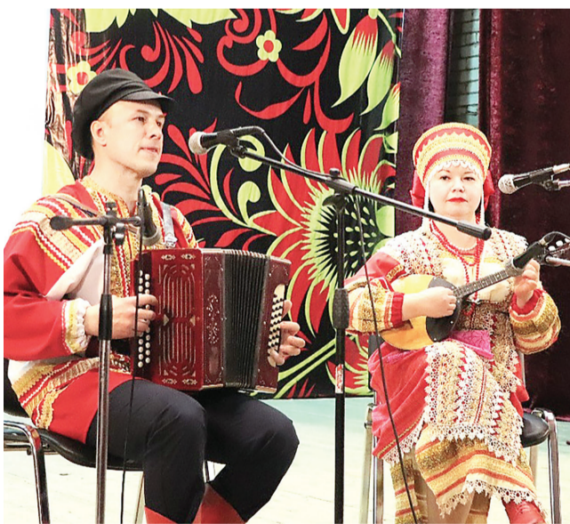
Участники ансамбля «Сказы»

В ансамбле сложились добрые традиции, главная из которых – гостеприимство. В этом году, как и в прошлом, гости остались довольны организацией и теплым, радушным приемом. Зал Леснополянского культурно-спортивного центра был заполнен до отказа. Атмосфера фестиваля была яркой, дружеской, наполненной теплом и искрометным юмором.