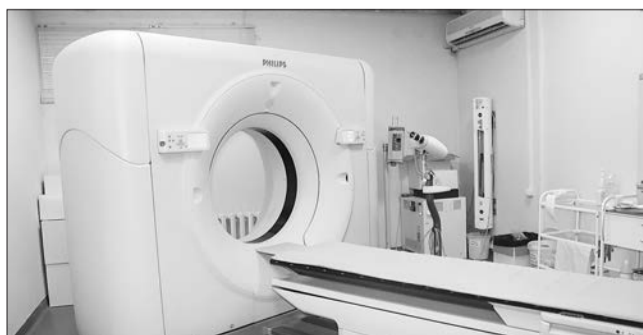
☒ Оборудование областной клинической онкологической больницы. http://onkoyar.ru

Что касается борьбы против рака, то отмечу: у нас появляются новые методы лечения и целые классы лекарственных препаратов, которые позволяют если не вылечить болезнь, то значимо продлить жизнь пациента. В этом году правительство Ярославской области выделило достаточно большие средства, для того чтобы обеспечить инновационными препаратами по определенным показаниям практически 100% заболевших. Так что борьба с онкологическими заболеваниями идет, и у нас есть успехи.