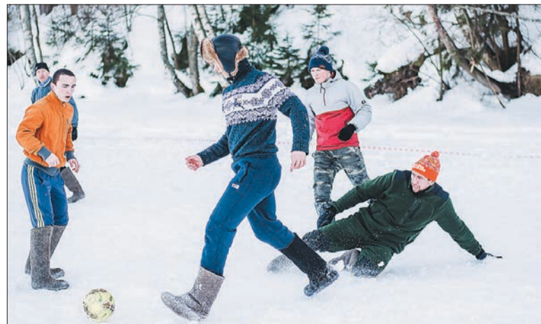
☞ Жаркий футбол на снегу

конкурса: «Оригинальная рецептура», «Творческий подход к изготовлению», «За волю к победе», «За слаженную работу команды», «За оперативность приготовления», «Мастерство и профессионализм», «За сохранение традиций» и «Народная уха». Замечательной ухи хватило на всех!