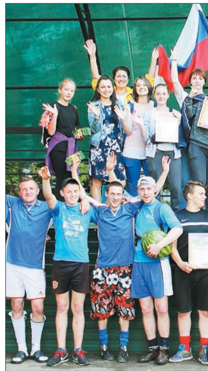
Молодежный слет поселения

На основании заявок в поселении составлена программа ремонта дорог на ближайшую перспективу внутри населенных пунктов. В прошлом году отремонтирована дорога в деревне Красный Бор. Местные жители просят открыть автобусный маршрут. На этот год запланированы ремонт трех километров районной дороги от областной больницы до деревни и обустройство разворотной площадки для автобуса. В 2018 году отремонтировали дороги в деревнях Шебунино, Глухово и Дымокурцы. В приёме работ участвовали местные жители, обнаружены недостатки. По суду подрядчик обязан устранить их согласно смете. Также отремонтирована районная дорога