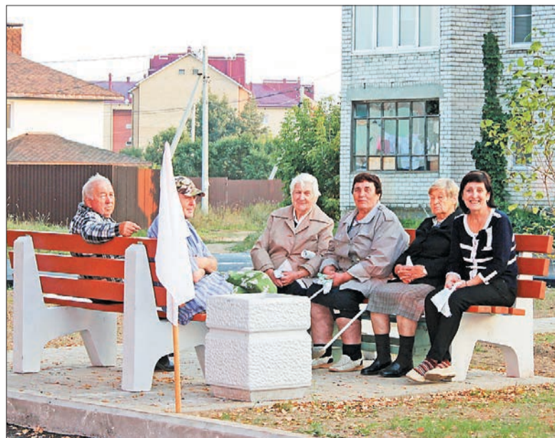
Обновленный двор в поселке Красный Бор

Впереди еще много дел. А где именно – зависит от инициативы жителей, их финансового и трудового участия. Это одно из главных условий реализации проекта «Решаем вместе!».