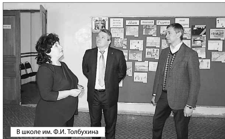
В школе им. Ф.И. Толбухина