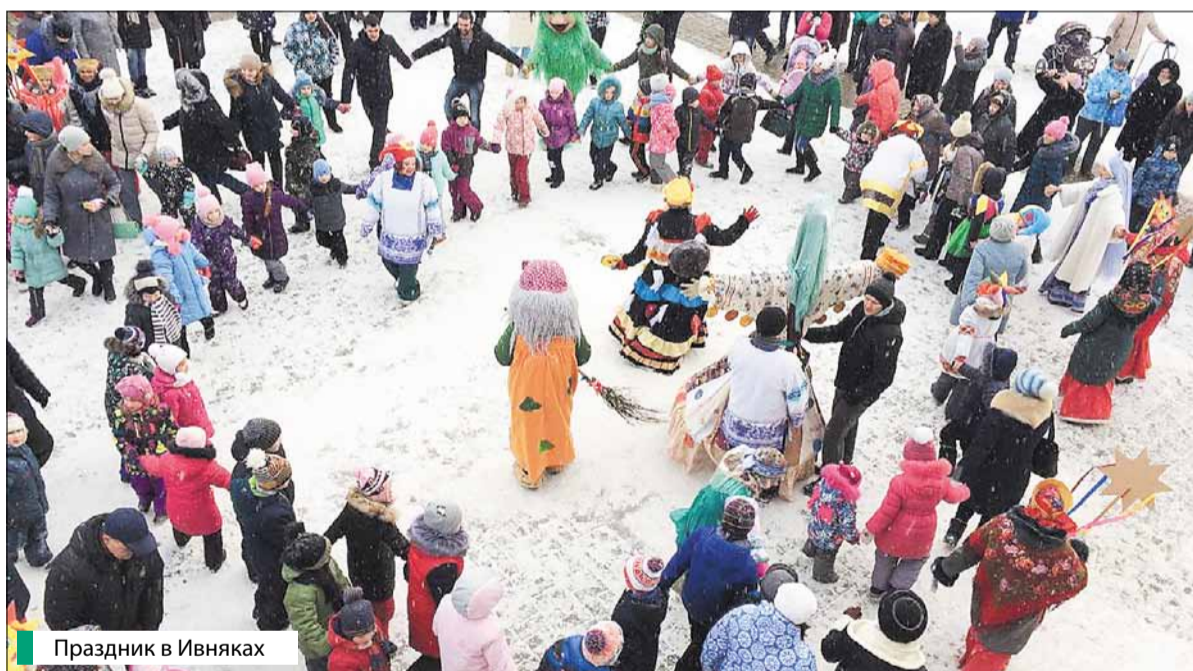
Праздник в Ивняках

Интересными конкурсами, удачными забавами и зажигательными танцами гости праздника проводили Зиму и встретили Весну. Главным угощением праздника стали традиционные масленичные блины. Хорошее настроение, не сходящие с лиц улыбки детей стали главным доказательством того, что праздник удался на славу!