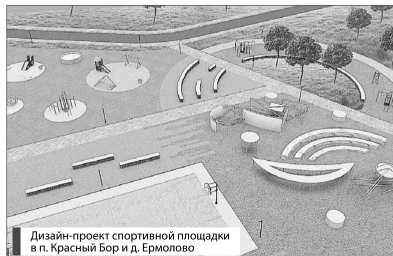
Дизайн-проект спортивной площадки в п. Красный Бор и д. Ермолово