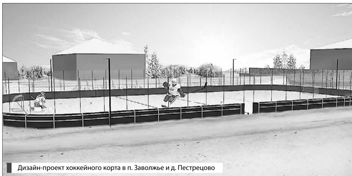
Дизайн-проект хоккейного корта в п. Заволжье и д. Пестрецово