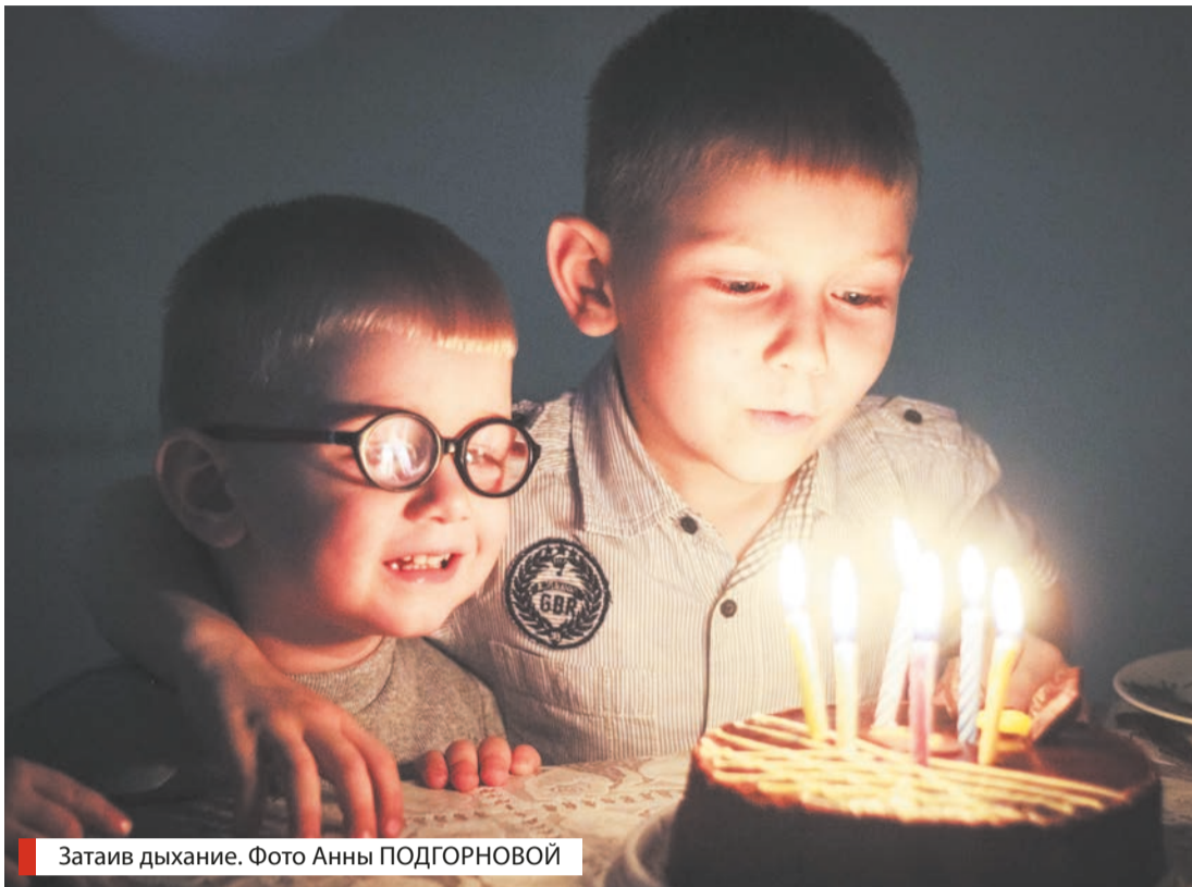
Затаив дыхание.