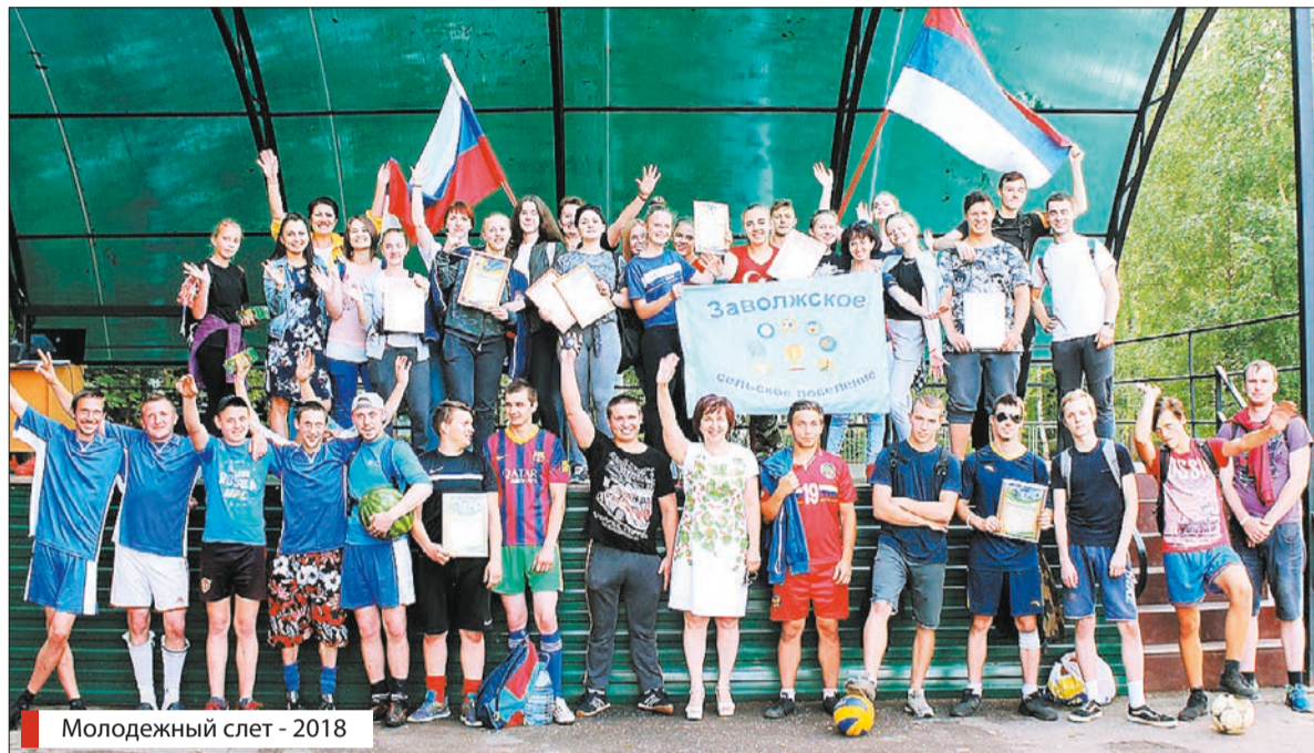
Молодежный слет - 2018

Патриотическое воспитание – один из приоритетов Григорьевского КСЦ. В преддверии 73-й годовщины Великой Победы в Спас-Витальевском доме культуры состоялся II Открытый конкурс чтецов Заволжского сельского поселения «Строки, опаленные войной». Участие в отборочных испытаниях приняли 69 артистов в возрасте от 8 лет, а 34 лучших чтеца завоевали право выступить в финале. Конкурс проходил в четырех номинациях: «Стихи», «Проза», «Литературно-