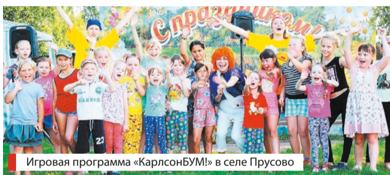
Игровая программа «КарлсонБУМ!» в селе Прусово

Еще одно направление нашей работы – возрождение и сохра-