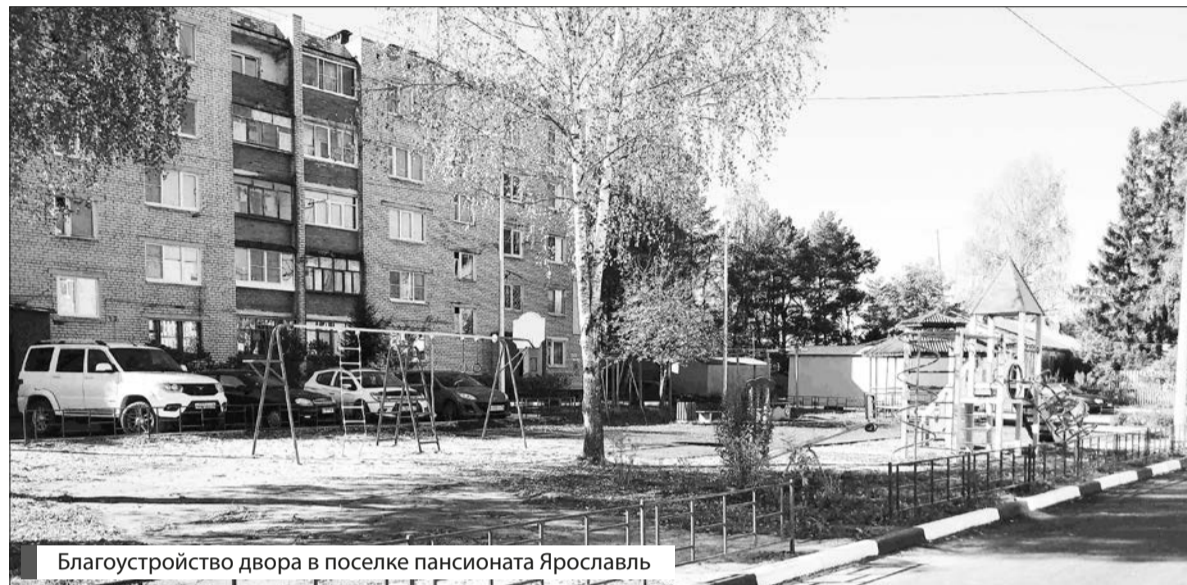
Благоустройство двора в поселке пансионата Ярославль

Программа «Решаем вместе!» направлена на выполнение поручения президента Владимира Путина по созданию комфортной среды в городах и сельской местности. Она стартовала в регионе в 2017 году по инициативе губернатора Дмитрия Миронова. За два года приведено в порядок около 900 объектов. Правительство области реализует проект совместно с партией «Единая Россия». В первый год финансирование составило 650 миллионов рублей, в этом году – 680 миллионов.