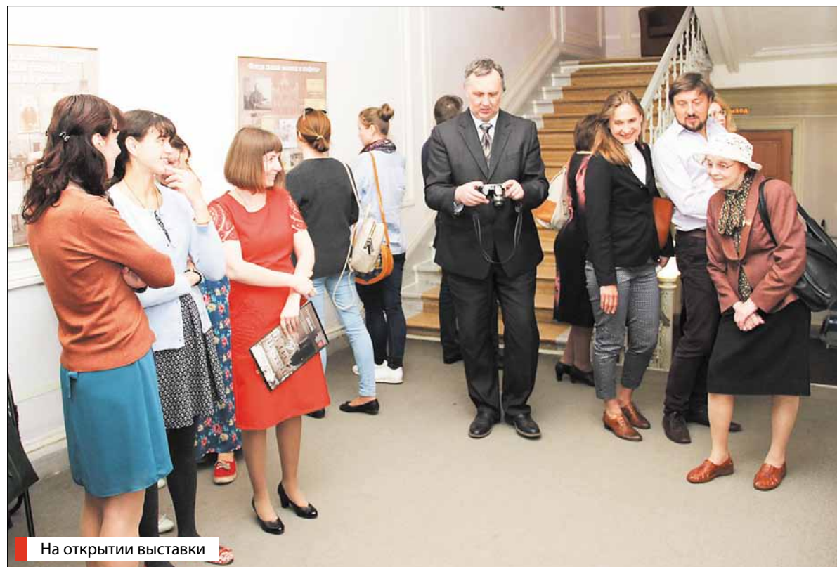
На открытии выставки

руководитель краеведческого музея Мокеевской школы