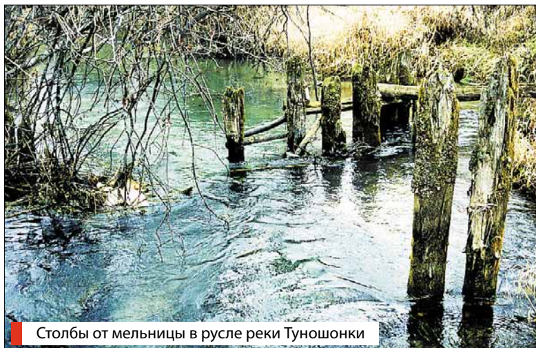
Столбы от мельницы в русле реки Туношонки

В двухстах метрах к юго-востоку от большого дома находится дом поменьше, одноэтажный. Раньше он был красиво украшен резьбой. Крыша крыта железом. На крыше были две башенки, подобные той, которая расположена на большом здании.