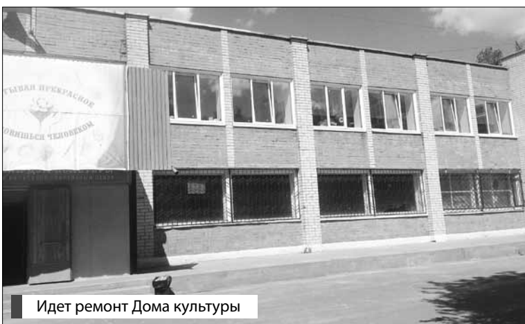
Идет ремонт Дома культуры

ки наш двор будет образцовым для поселения, и по его примеру будут ремонтировать другие дворы.