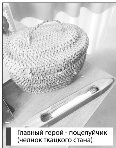
Главный герой - поцелуйчик (челнок ткацкого стана)

Старая фабрика, к которой относились не только само про-