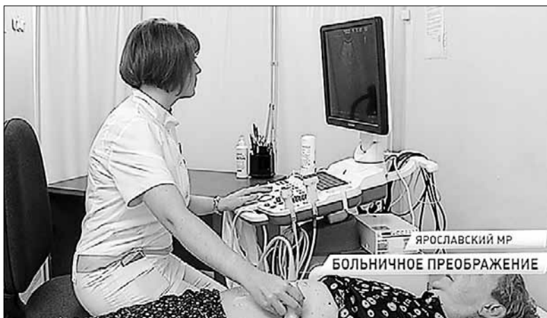
ЯРОСЛАВСКИЙ МР БОЛЬНИЧНОЕ ПРЕОБРАЖЕНИЕ