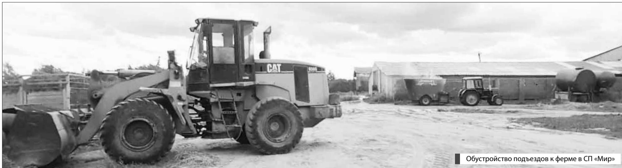
Обустройство подъездов к ферме в СП «Мир»