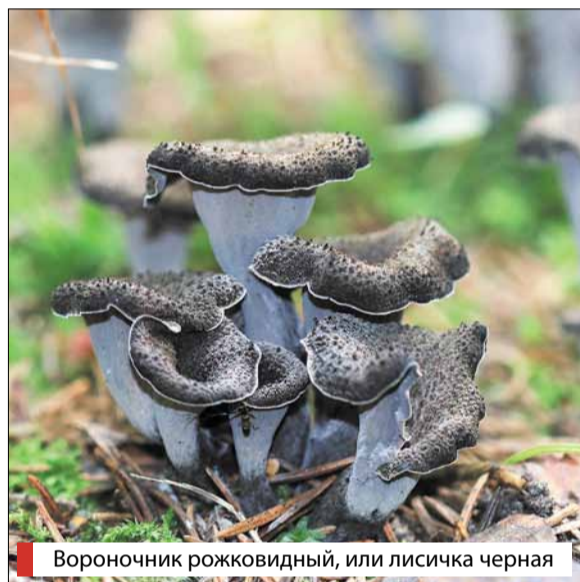
Вороночник рожковидный, или лисичка черная