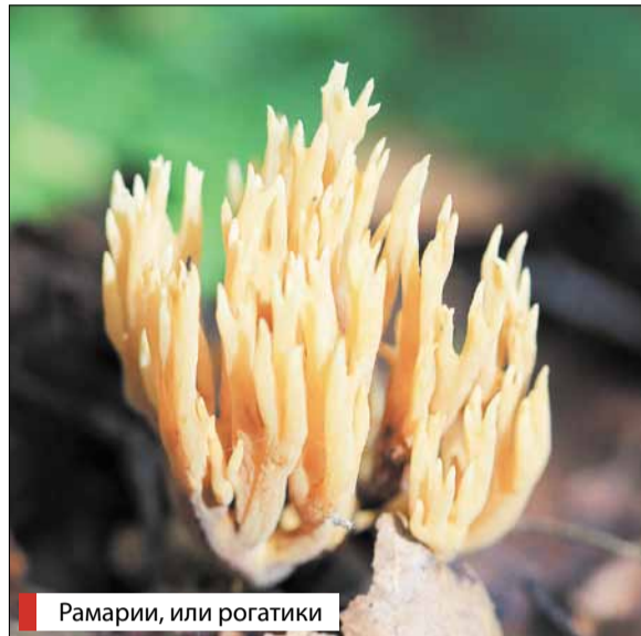
Рамарии, или рогатики

Непривычной формы гриб совершенно бесполезен в отношении кулинарии. Да и пробовать мутинус вряд ли кто-либо