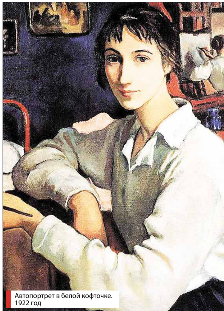
Автопортрет в белой кофточке. 1922 год