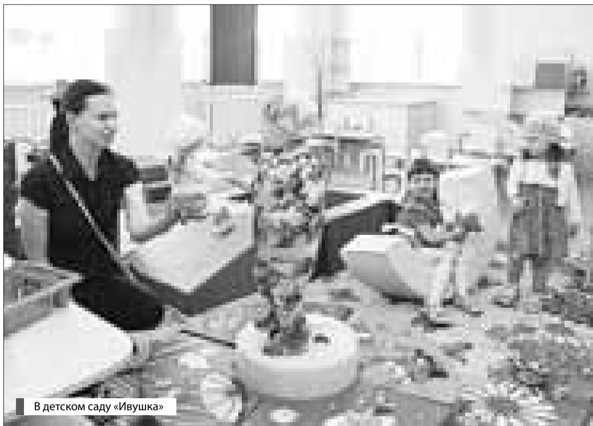
В детском саду «Ивушка»

– По крайней мере, те жалобы и обращения, которые я беру под свой контроль, стараюсь выполнить или дать аргументированный ответ, почему это невозможно. Но район большой, обращений очень много. Иногда даже со сроками трудно управиться, чтобы их не нарушать. Поэтому, конечно, все 100% обращений выполнить невозможно. Но радует то, что в прошлом году мы выполнили обращение по транспортному сообщению поселка Красный Бор. Долго мы решали эту проблему, но общими усилиями с ней удалось справиться. На сегодняшний день в Красный Бор ходит автобус, маршрут которого удобен для населения, так как он идет по городу. На сегодня практически решена проблема транспортного сообщения деревни Сабельницы Ивняковского поселения – нам обещают, что транспорт туда пойдет уже с марта. Жители Ивняковского поселения давно просили связать поселок с Крестами, чтобы было удобнее добираться до Карабах-