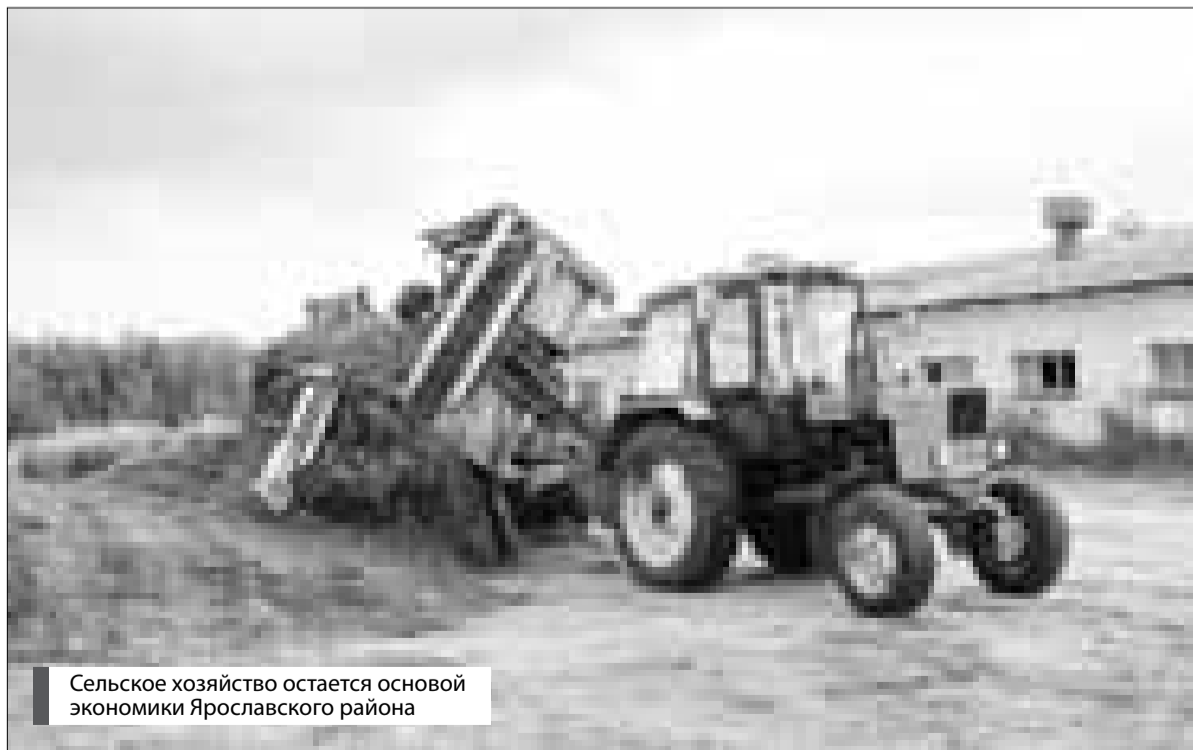
Сельское хозяйство остается основой экономики Ярославского района

– Бюджет 2017 года мы сбалансировали по всем направлениям, и он сверстан под программы. Мы также заложили в него средства под объекты, необходимые населению района, предложенные