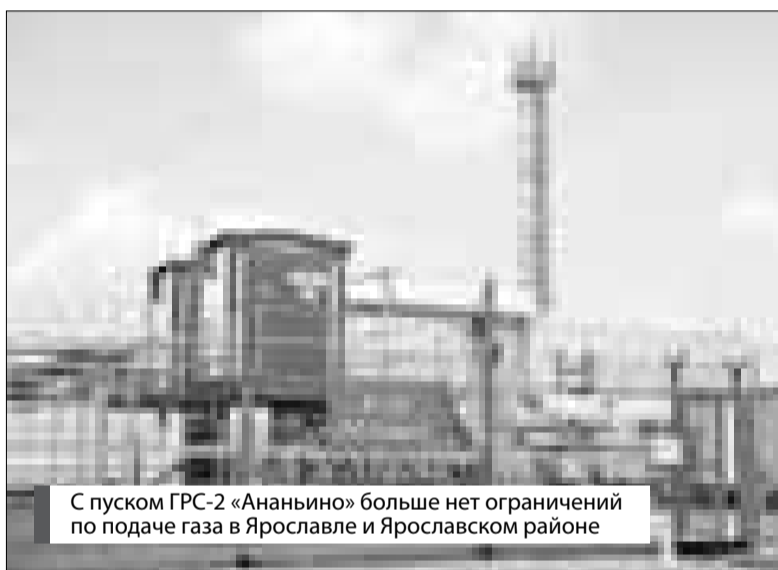
С пуском ГРС-2 «Ананьино» больше нет ограничений по подаче газа в Ярославле и Ярославском районе

– Самая передовая отрасль – это сельское хозяйство. Ярославский район лидирует в этой отрасли традиционно на протяжении всей своей истории или, по крайней мере, в постсоветский период. Высокую урожайность дали наши хозяйства и в прошлом году: картофеля – 269 ц/га, овощей открытого грунта – 398 ц/га, зерновых – 28 ц/га. Про-