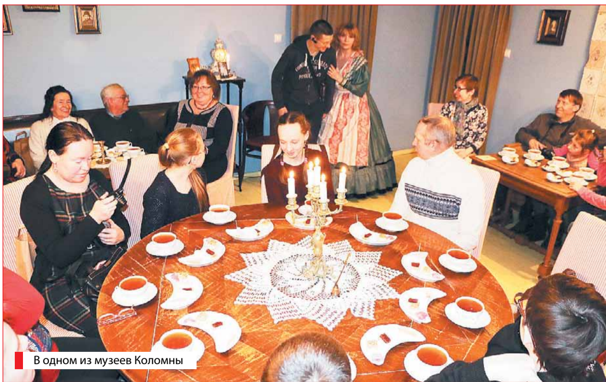
В одном из музеев Коломны

Ярославского районного центра сохранения культурного наследия и развития туризма