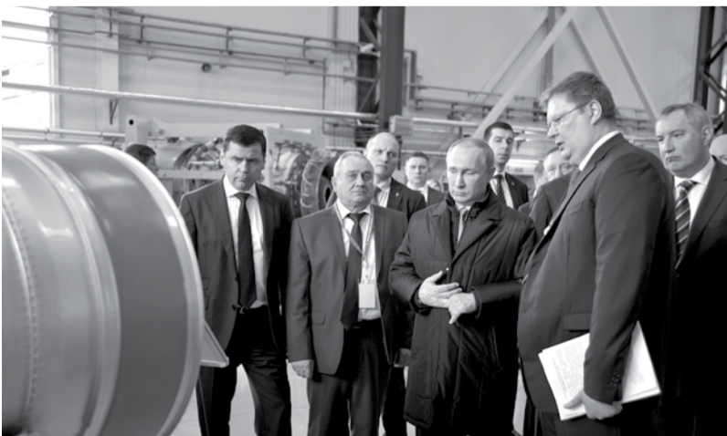
Глава государства посетил завод НПО «Сатурн»

Уже 198 рейдов проведено в период ограничения рыболовства на водоемах области. У браконьеров изъято 364 килограмма рыбы, 21 сеть, возбуждено 12 уголовных дел. Напоминаем, что на период нереста, с 15 апреля по 15 июня установлены ограничения для любительского и спортивного рыболовства. Разрешается только любительская ловля на удочку с берега вне мест нереста, количество крючков — не более двух. Промышленное рыболовство запрещено. ■