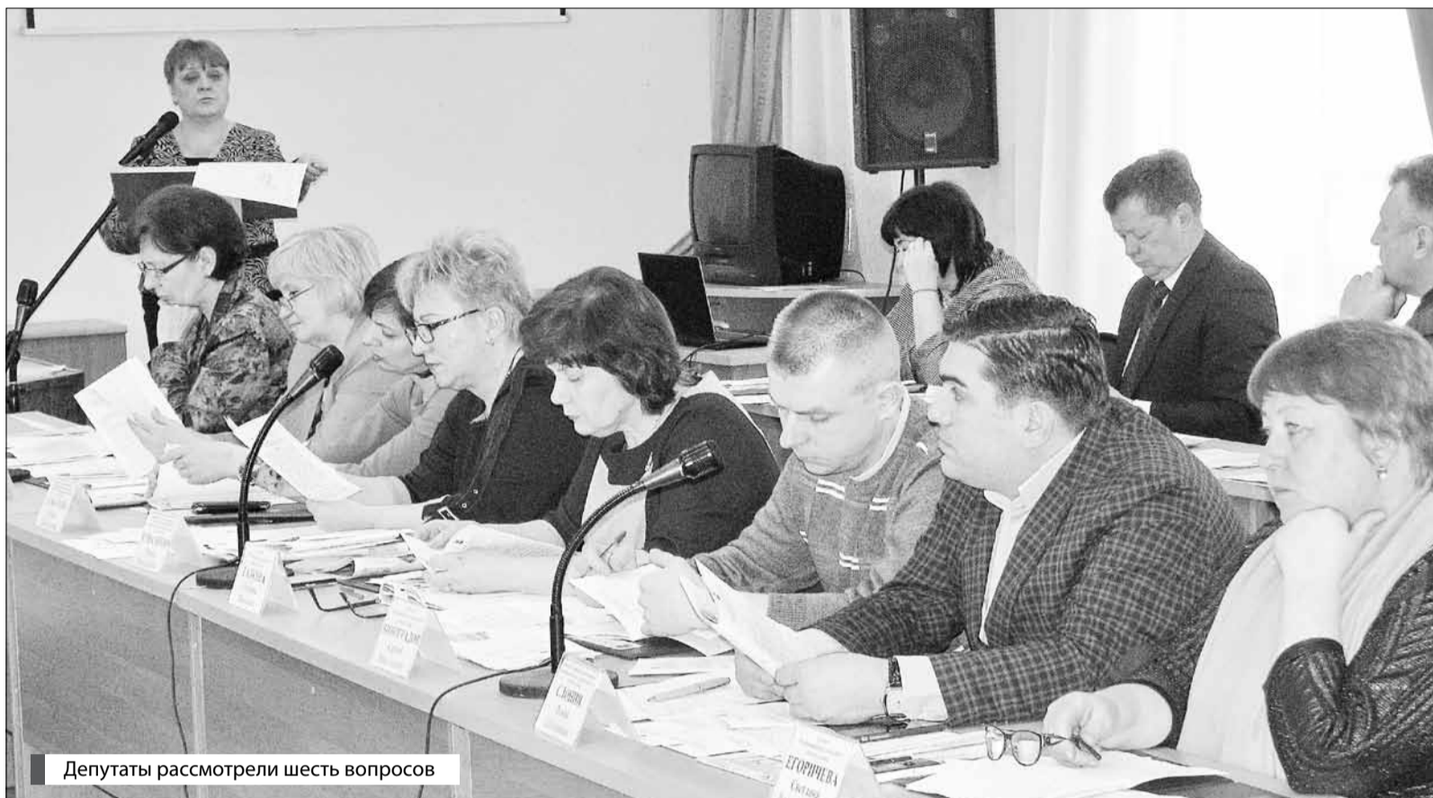
Депутаты рассмотрели шесть вопросов