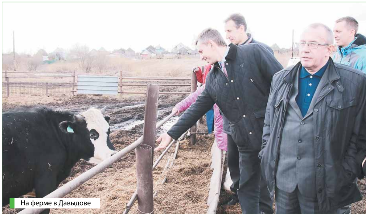
На ферме в Давыдове