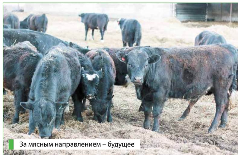
За мясным направлением – будущее