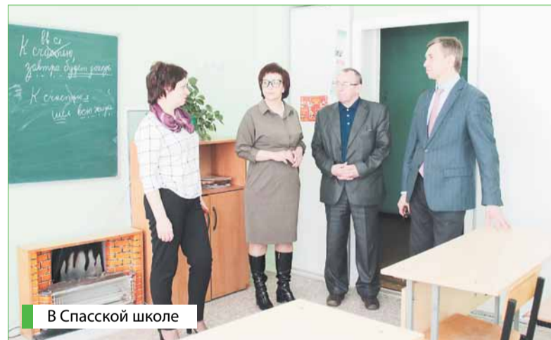
В Спасской школе