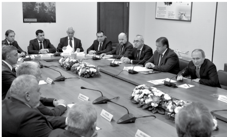
Президент встретился с бизнес-сообществом Ярославской области