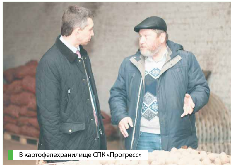
В картофелехранилище СПК «Прогресс»