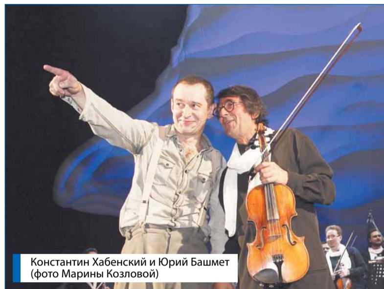
Константин Хабенский и Юрий Башмет