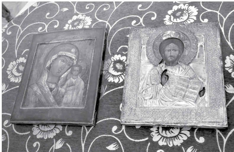
Казанская икона Божией Матери и икона «Господь Вседержитель».

Казанская икона Божией Матери середины XIX века и икона «Господь Вседержитель» конца XIX века органично дополнили воссозданный класс земского училища, открытый в Карабихе в 1894 году. Одним из обязательных предметов в земском училище был Закон Божий и Священная история, поэтому в классе, в «красном углу» в разные годы находились эти образа.