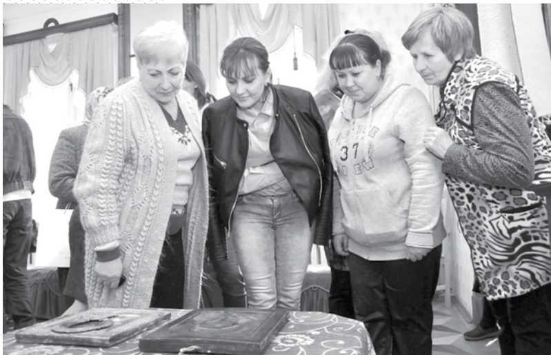
Старинные иконы в музее-заповеднике «Карабиха».

ПРАВОСЛАВНЫЕ СВЯТЫНИ 19 ВЕКА ДОПОЛНИЛИ ЭКСПОЗИЦИЮ В МУЗЕЕ-ЗАПОВЕДНИКЕ КАРАБИХА