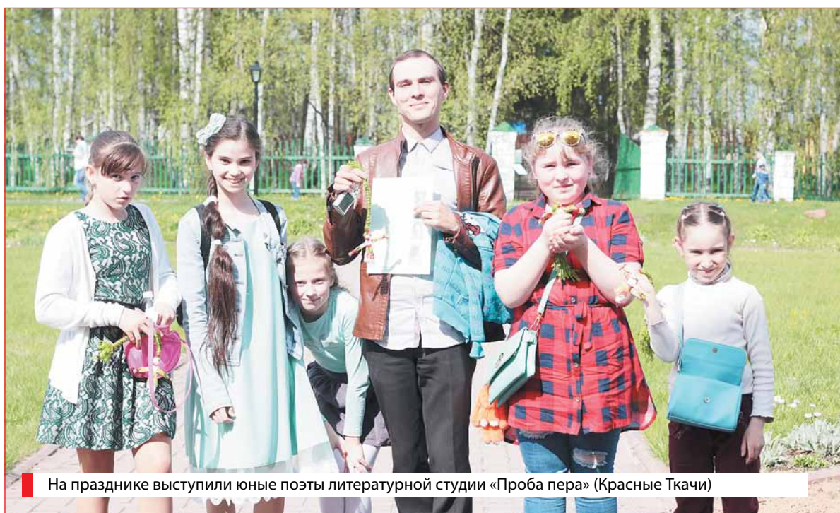
На празднике выступили юные поэты литературной студии «Проба пера» (Красные Ткачи)