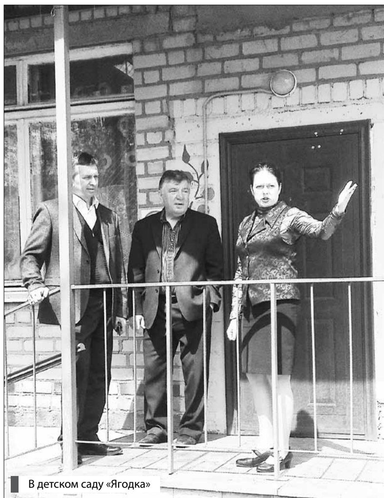
В детском саду «Ягодка»