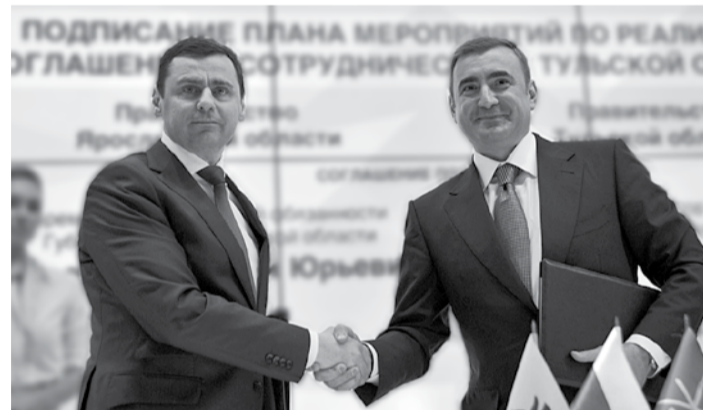
Дмитрий Миронов и Алексей Дюмин

На форуме Дмитрий Миронов представил туристический потенциал региона. Нам действительно есть чем гордиться. Ярославская область сегодня входит в десятку лидеров по темпам развития туризма.