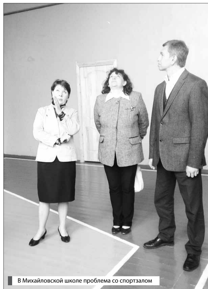
В Михайловской школе проблема со спортзалом