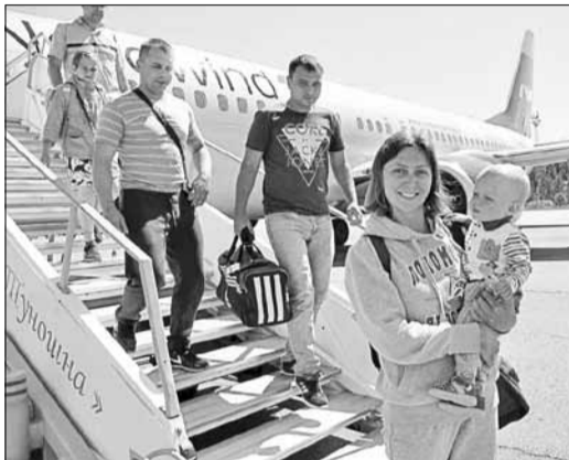
9 июня аэропорт Туношна открыл авиарейсы по направлению Ярославль – Симферополь.