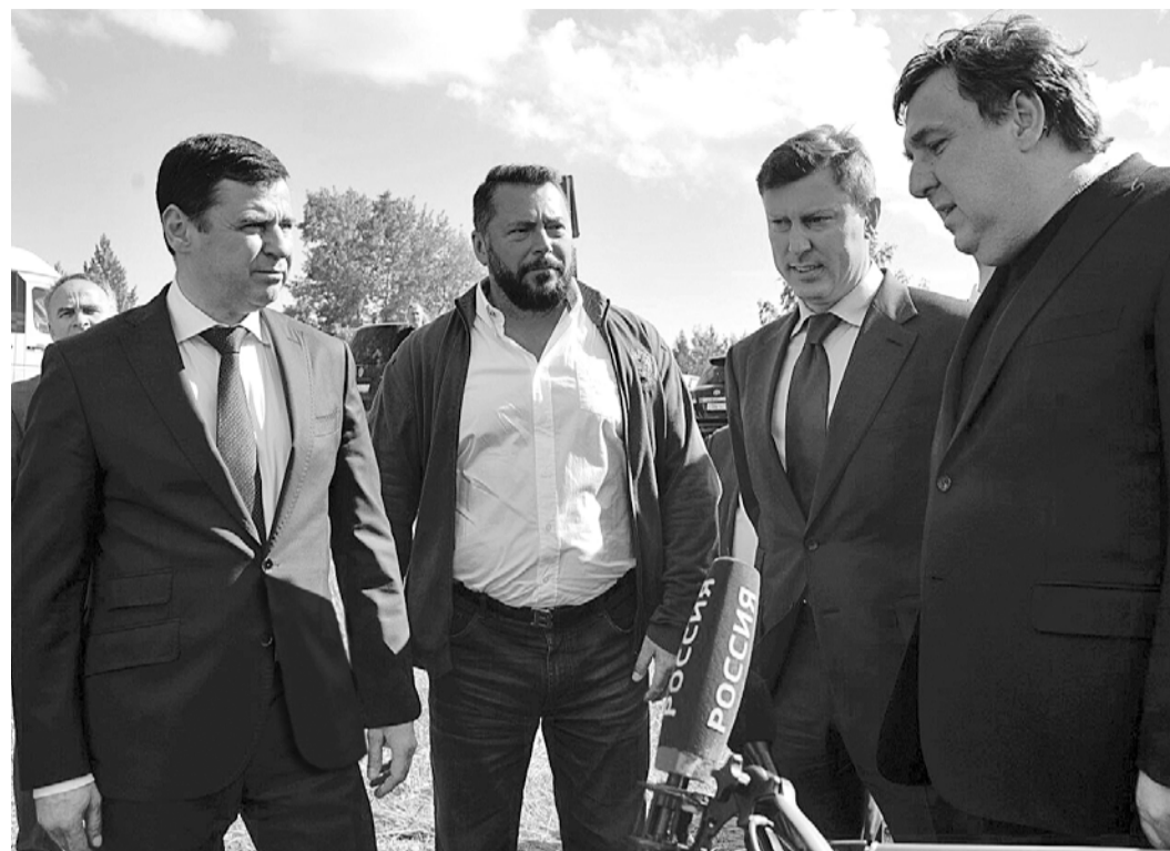
Рабочая поездка в Ростовский район

– Объём финансирования дорожных работ составит более 5 млрд рублей, что позволит нам