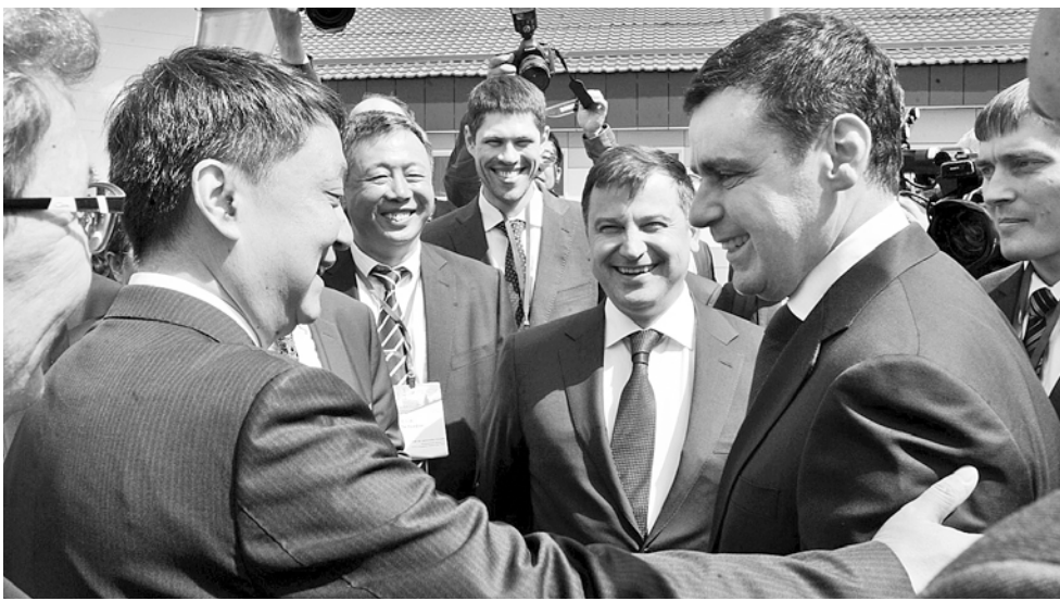
На открытии совместного российско-китайского проекта

В Ярославской области введена в эксплуатацию Хуадянь-Тенинская ТЭЦ. Это крупнейший инвестиционный энергетический проект, реализуемый Китаем в России, ТЭЦ не имеет аналогов в стране. Экономия топлива – природного газа – составит примерно 25 процентов. На треть должны снизиться объёмы выбросов в атмосферу.