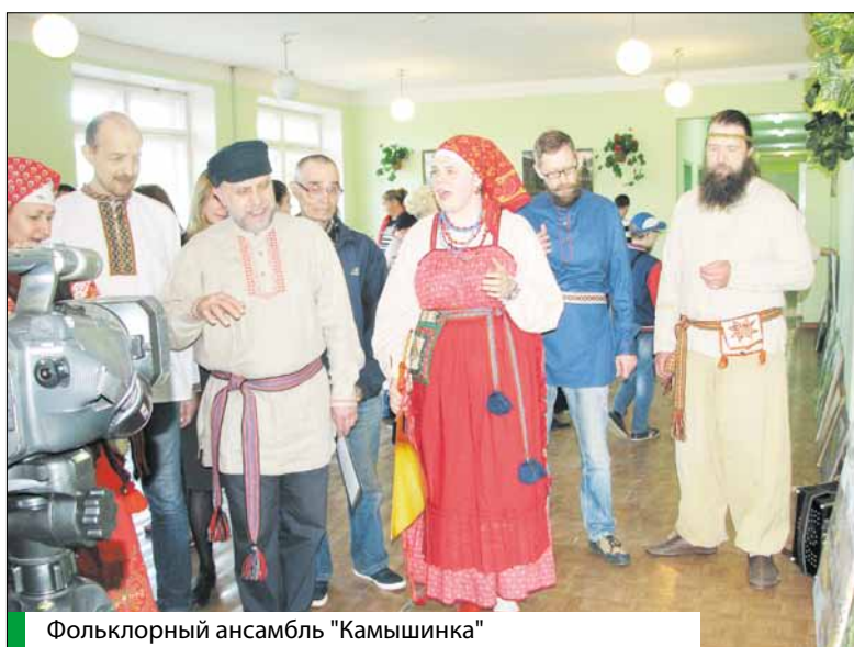
Фольклорный ансамбль «Камышинка»

Рядом с Казанской церковью сохранился зимний Воскресенско-Никольский храм. Недавно в его стенах прошел субботник, добровольцы разбирали конструкции находившегося здесь раньше клуба. Инициаторы восстановления надеются, что весь храмовый комплекс вместе с колокольной будет со временем возрожден.