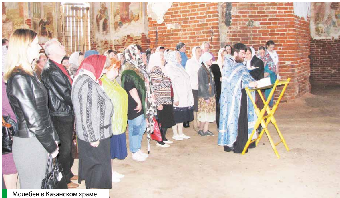
Молебен в Казанском храме