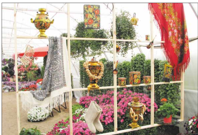
Наш корр. Фото Бориса КУФИРИНА