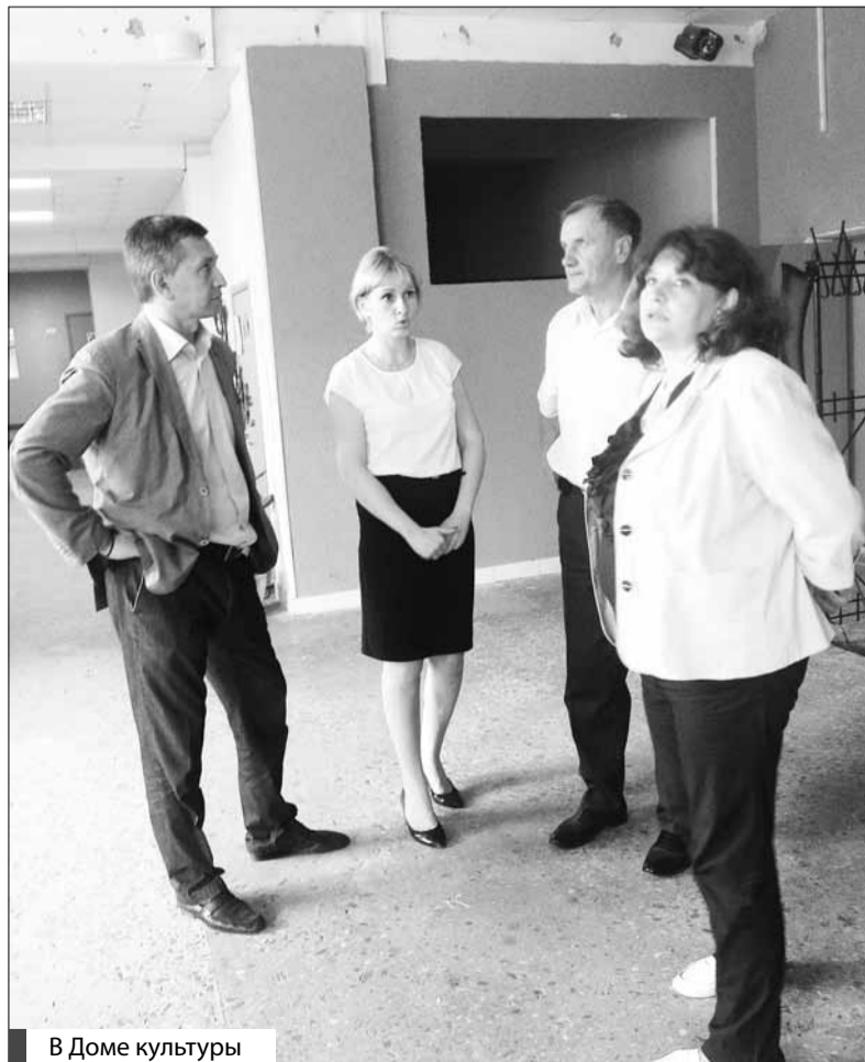
В Доме культуры