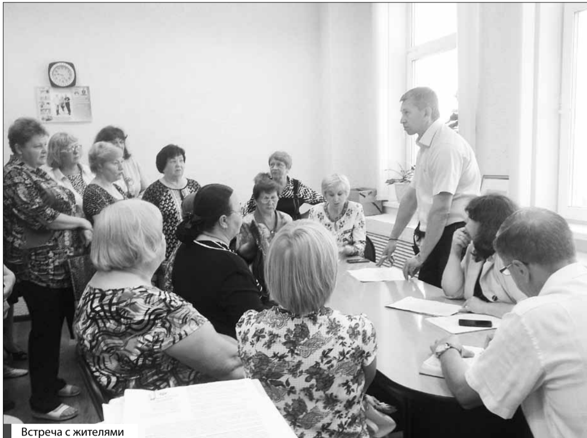
Встреча с жителями

Большая делегация жителей этих домов, которые пришли на встречу с главой, очень эмоционально рассказали главе района об этой ситуации, которая годами не решается, куда бы они ни обращались. С 2013 года жители домов не могут решить проблему. Причиной перебоев является то, что дома расположены на отшибе, электроэнергии от поселковой подстанции на них