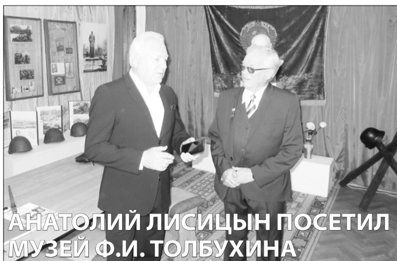
АНАТОЛИЙ ЛИСИЦЫН ПОСЕТИЛ МУЗЕЙ Ф.И. ТОЛБУХИНА