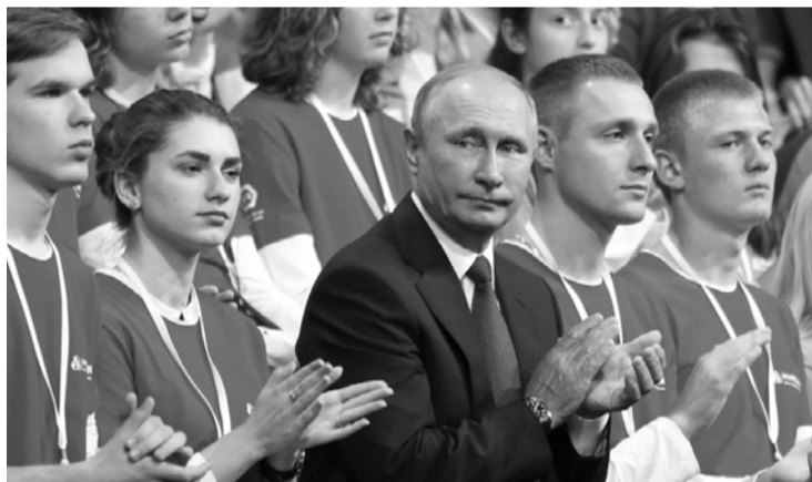
На всероссийском форуме «ПроеКТОрия»

Открытый урок «Россия, устремлённая в будущее» глава государства начал с поздравления с Днём знаний.