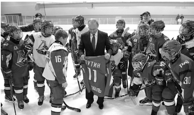
Юные хоккеисты подарили президенту свитер «Локомотива»