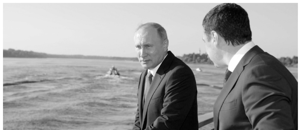
На борту теплохода «Россия»